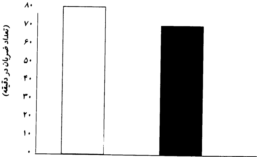
نمودار ۲- میانگین ضربان قلب زمان استراحت پیش آزمون و پس آزمون