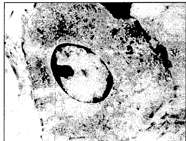
تصویر ۳- تصویر الکترومیکروسکوپی یک اووسیست کریبتوسپوریديوم شبه موريس در شیردان آلوده.