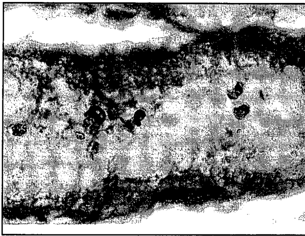
تصویر ۲- مقطع هیستولوژیک از شیردان گاو آلوده به کریبتوسپوریديوم آندرسونی. در این شکل مجرای یک غده پیتیک شیردان که حاوی اووسیست های انگل به رنگ قرمز می باشد مشهود است. رنگ آمیزی غیراختصاصی MZN بزرگنمایی ۴۰۰x.