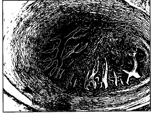
تصویر ۳- مقطع سیستی سرکوس بویس. ۱- دیواره کیسه سیستی سرک. ۲- اجسام آهکی (رنگ آمیزی H&E، بزرگ نمایی ۶۴x).

در این بررسی کلیه سیستی سرک ها در بافت همبندی بین پوشش مزوتلیال لایه سروزی و سطح بیرونی لایه خارجی عضلات دیواره شکمبه جای گرفته بودند و در سایر قسمتهای آن بویژه در لایه های عمقی تر عضلات دیواره شکمبه متاستاز یافت نشد و محل آنها تا حدودی با محل جایگزینی سیستی سرک ها در قلب مشابه بود هر چند سیستی سرک های دیواره قلب در مقایسه با شکمبه، به نسبت عمیق تری در بین دستجات ماهیچه ای جایگزین شده بود. تاکنون محل جایگزینی سیستی سرک ها در دیواره شکمبه در آلودگی طبیعی گزارش نشده است. طبق نظر Hubbert و همکاران در سال ۱۹۷۵، سیستی سرکوس بویس در عضلات قلب در فضاهای لنفاتیکی بین دستجات فیبرهای ماهیچه ای و در سایر ماهیچه ها در بافت همبندی جدا کننده دستجات سلولهای عضلانی جاسازی می شوند (۷). در بررسی مقایسه ای میان ضایعات میکروسکوپی ایجاد شده توسط سیستی سرک ها در شکمبه و قلب همان حیوان، واکنش آماسی ایجاد شده در برابر انگل در قلب و شکمبه تا حدود زیادی یکسان بود اما در قلب، کپسول اطراف سیستی سرک ها، علاوه بر ضخامت بیشتر دارای تعداد زیادتری لمفوسیت نیز بودند.