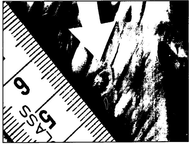
تصویر ۱- سیستی سرکوس بویس در جدار شکمبه گاو. ۱- سیستی سرکوس بویس. ۲- مخاط شکمبه.