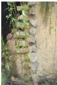
تصویر ۷- دیوار زگمه ای

سیستم سازه ای دیوار بنای شیکیلی، "زگمه" است. ساخت دیوار زگمه ای مطابق تصویر شماره ۷ بدین شرح است که دو عدد گردبینه با قطری در حدود ۲۰ سانتیمتر و طولی در حدود ۴ متر در فاصله ۳ الی ۳/۵ متری قرار داده و دو عدد گردبینه دیگر را نیز عمود بر آنها در همین فاصله قرار می دهند طوری که در نقاط تلاقی، گردبینه ها در حدود ۲۰ سانتیمتر روی هم قرار گیرند. این امر به منظور استقرار بهتر چوب های زگمه دیوارهای مجانب است که بدون هیچ اتصالی روی هم واقع می شوند. پس از آن، لایه دیگر و لایه های بعد را روی آنها یک در میان قرار می دهند.