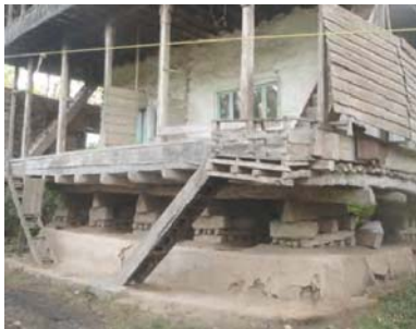
تصویر ۲- احداث پاکه برای ساخت پی

پاکه کوبی با به کار گیری سنگ لاشه نیز صورت می گیرد. بدین ترتیب که سنگ لاشه را توسط احشام تا محل احداث بنا حمل کرده و با استفاده از آن به جای مخلوط رود خانه ای بستری محکم تر و با عمق کمتر می ساختند. چنانکه برای پاکه کوبی با سنگ لاشه حفر زمین تا عمق ۱ متر کافی می بود. پس از آنکه پاکه تا ارتفاع مورد نظر از سطح زمین ساخته شد، روی آن را با مخلوط خاک رس و "فل" اندود می کنند. هم اکنون بستر مناسب جهت احداث پی آماده است. پاکه امکان توزیع همگن بارهای قائم ساختمان را به زمین مهیا می سازد. شایان ذکر است که در این منطقه زمین متشکل از خاک رس حساس و تراز آب های زیرزمینی بالاست. ابعاد پاکه همان ابعاد بنای مسکونی است (تصویر شماره ۲).