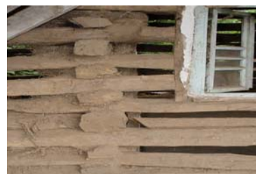
تصویر شماره ۸- قرارگیری گردبینه ها و چارچوب پنجره

جهت ساخت در و پنجره که معمولاً در وسط دیوار احداث می گردد از گردبینه های کوتاه تر استفاده می شود. اما برای نعل درگاه از گردبینه هایی با طول دیوار استفاده می نمایند (زمرشیدی، ۱۳۶۸، ص ۳۱۱). در حین ساخت دیوار به منظور اجرای بهتر درو پنجره، چارچوب کاذبی قرار داده و پس از اتمام ساخت دیوار در زمان ملات گیری روی زگمه، چارچوب اصلی را به جای چارچوب کاذب به کار برده و محکم می نمایند (تصویر شماره ۸). مکان تعبیه در و پنجره در لایه دوم نمای اصلی است. جایی که با ایوان ارتباط درجه یک داشته و امکان دستیابی به اتاق ها از طریق ایوان یا تلار است. این ایوان اصلی معمولاً بسته به شرایط بادهای محلی و کج باران) در جبهه جنوبی بنا است که نور مناسب و افزایش عمق نفوذ آفتاب زمستانی را داراست. در برخی از بناها مابین دو اتاق هر طبقه، در یا دریچه هایی برای دسترسی اتاق مجاور تعبیه می گردد. اما تعمداً در جبهه هایی از بنا که در معرض ج باران ها قرار می گیرد هیچ روزنی یافت نمی شود.