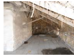
تصویر ۱۶- فاکن

این نوع سقف با لایه متخلخل پوشش نهایی، عایق حرارتی و صوتی بسیار خوبی در جهت تامین آسایش انسان ساکن در بنا است. ولی همانطور که ذکر شد دشواری نگهداری این نوع بام موجب شده تا کثیری از بناهای گالی پوش در دهه های اخیر نوع پوشش خود را از الیاف گیاهی به ورق گالوانیزه تغییر دهند. علی رغم عمر طولانی ورق های گالوانیزه وسهولت نگهداری آن، انتقال صدا مخصوصاً صدای باد و بارش های طولانی مدت، انتقال حرارت ناشی از تابش در تمام طول تابستان و سرمای زمستان به داخل خانه، موجب شده تا رفاه و آسایش ساکنین خانه به طور محسوسی کاسته شود.