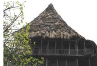
تصویر ۱۱- سقف گالی پوش جلگه مرکزی گیلان

یکی از مهم ترین مراحل ساخت خانه های شیکیلی سقف نهایی است. سقف نهایی بنای مسکونی که احداث پی و طبقات آن به تفصیل تشریح شد، چهارشیبه بوده و شیب زیاد آن روش مناسبی برای هدایت آب باران های زیاد و طولانی منطقه است که مراحل ساخت آن به شرح زیر می باشد (تصویر شماره ۱۱).