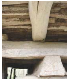
تصویر ۶- قرارگیری فک، بنه دار، کمرکش و زغال طبقه اول

شده را به پی شیکیلی منتقل می سازد "بنه دار" و "کمر کش" نام دارند.