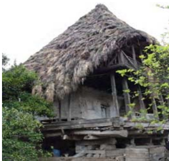
تصویر ۱۷- پوشش روی ایوان (فاکن)

فاکن همان ایوان های نیمه محصور جانبی و پشتی است که با امتداد دامنه سقف تا پایین ایوان بوجود می آید (تصویر شماره ۱۶). این فضای دوزنقه ای یا مثلثی شکل در زمستان جهت انبار مواد غذایی، لوازم منزل و انجام برخی فعالیت های درجه پایین روز مورد استفاده قرار می گیرد و در تابستان مکانی است برای تبدیل برخی محصولات زراعی و باغی و آماده سازی برای استفاده ویا عرضه به بازار. زمان ساخت فاکن پس از پایان یافتن کار ساختمان سازی و گاه بعد از گذشت چند سال از استفاده بنا می باشد. نحوه اجرای فاکن بدین صورت است که توسط ویریس تیرهایی درجهت سرچوها به تیر اصلی سقف می بندند و مطابق ساخت سقف اصلی با آجارها و دسته های زغال سقفی یکپارچه با امتدادی تا نزدیک سطح زمین می سازند (تصویر شماره ۱۷). پس از اجرای این مرحله، ساخت خانه شیکیلی به پایان می رسد.