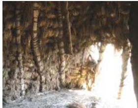
تصویر ۱۳- بستن اجزاء بام

با ویریس بسیار محکم می بندند. این عمل در روی زمین انجام می شود. سپس این اجزاء را توسط طناب به بالای ساختمان منتقل کرده و افرادی در پایین ساختمان دو طرف این چوب ها را با طناب کنترل می نمایند و سپس آنها را در جای خود یعنی وسط اضلاع سقف طبقه دوم قرار می دهند. در این هنگام فردی ماهر با بالا رفتن از سرچوها خود را به قله آن رسانده و تمام اعضاء سرچو را توسط ویریس به هم محکم می کند (تصویر شماره ۱۳).