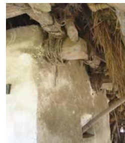
تصویر ۱۲- اتصال سرچو توسط ویریس

توجه به این نکته حائز اهمیت است که در بنای شیکیلی، تا این مرحله یعنی اتمام اجرای سقف طبقه دوم که واشان ریزی شده و زغال روی آن نصب می گردد، از هیچ قطعه ای جهت اتصال و بستن اجزاء چوب استفاده نگردیده و عناصر در اثر وزن خود روی هم قرار می گیرند و ملات کلوش گل ۱۷ آنها را به هم محکم می سازد حتی چارچوب درها و پنجره ها فقط توسط ملات به دیوارها متصل می باشد.