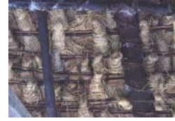
تصویر ۱۵- فرارگیری دسته های گالی در بین آجارها

دسته های انبوه این الیاف گیاهی، با شیب زیاد سقف (شیب ۱۰۰ تا ۲۰۰ در صد برای گالی و کلوش)، موجب هدایت آب باران به پایین شده و علی رغم آنکه جلگه مرکزی گیلان دارای بیشترین بارش سالیانه است، نفوذ آب باران را به اجزای اصلی بنا مشاهده نمی نمائیم. تنها ضعف این مصالح برای سقف، طول عمر کوتاه آن است. چنانکه سقف های گالی پوش نیاز به ترمیم های دوره ای داشته و عمر نهایی آنها در حدود ۴ سال است. علی الخصوص در جبهه های رو به کج باران ۲۶ مرمت سقف، گاه سالیانه است. هر ساله پس از واریسی، باید دسته های نو گالی را با قسمتهای پوسیده عوض نمود.