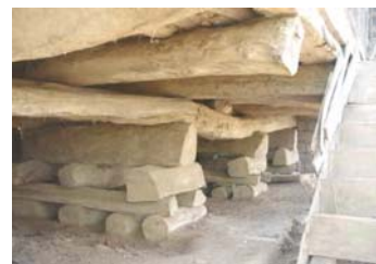
تصویر ۵- اجزاء پی شیکیلی: ریت، زی، کتل و فک

همانگونه که مشاهده می شود هر کدام از این پی ها که از نوع پی های نقطه ای هستند با شکل دوزنقه ای خود بار ساختمان را در سطحی وسیع تر به بستر تحکیم یافته، منتقل می نمایند (تصویر شماره ۵). شایان ذکر است در این نوع از ساخت پی، هیچ گونه اتصالی مابین اجزای تشکیل دهنده، وجود ندارد و تنها نیروی فشاری بار ساختمان و شکل هرم ناقص پی ها، موجبات ایستایی ساختمان را مهیا می سازند. جالب تر آنکه بهنگام وارد آمدن نیروهای جانبی مخرب مانند زلزله، امکان حرکت اندک اجزاء ساختمان، سبب پایداری کل بنا بوده و اتصالات صلب و خشک در این نوع ساختمان وجود ندارد. چنانکه عامل تخریب بسیاری از بناهای امروزی گسستن اتصالات صلب در نقاط حساس تحمل بار می باشد. همچنین این حرکات جزئی اجزاء پی، وجود عنصری برای توزیع افقی نیرو، مانند شناژ پی های نقطه ای را، منتفی می سازد.