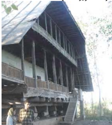
تصویر ۳- بنایی با پی شیکیلی در رودبند

برای ساخت خانه ای با دو اتاق در هر طبقه، روی پاکه ۱۰ عدد پی شیکیلی در دو ردیف ۵ تایی به شرح زیر احداث می شود (تصویر شماره ۳).