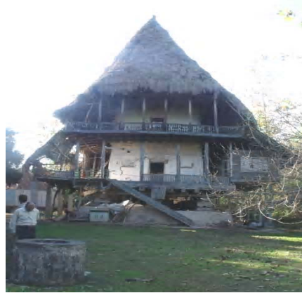
تصویر ۱- خانه شیکیلی حوالی لاهیجان

ابتدا روی پاکه ۴ الی ۶ عدد گردبینه ۵ درخت توت به قطر تقریبی ۳۵ سانتیمتر و طول حدود ۱ متر در محور طولی ساختمان قرار می دهند که به آن "ریت" می گویند. چوب درخت توت از نظر مقاومت در برابر رطوبت مناسب بوده به همین دلیل در تحتانی ترین لایه پی کاربرد مطلوبی دارد. اما لایه های بعدی حسب امکانات ساخت، معمولاً از چوب هایی است که تحمل فشار در جهت عمود بر الیاف های طولی آن بیشتر باشد. بر روی ریت و عمود بر آن سه عدد گردبینه یا چهار تراش با قطر تقریبی ۲۵ سانتی متر به