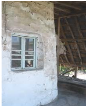
تصویر ۹- جمع شدن دیوارها به داخل

برای ساخت کف طبقه، از الوارهای تبری که حاصل ترکاندن گردبینه ها به وسیله تبر در جهت الیاف طولی چوب است، "زغال" ۱۵ ساخته و کف بنا را عمود بر واشان ها، با زغال می پوشانند. به عبارتی اسکلت دیوار یعنی زگمه، مستقیماً روی واشان یا کمرکش قرار گرفته و فضای کف بین دیوارها با زغال پر می گردد.