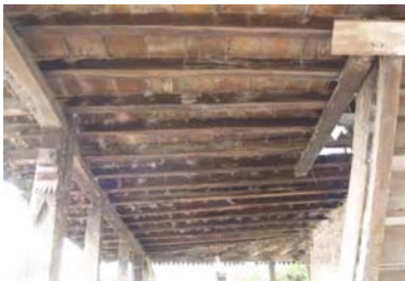
تصویر ۱۰- سقف طبقه دوم

واشان اصلی به منظور ساخت کف طبقه دوم روی واشان کاذب قرار می گیرد. طبقه دوم بنا همانند طبقه زیرین احداث می گردد.