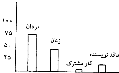
نمودار ۲: مقایسه عملکرد مردان و زنان

از این تعداد مقاله ۱۲۶ مورد (۳۰/۲۸٪) توسط اعضای هیأت علمی دانشگاهها، ۳۶ مورد (۸/۶۵٪) به وسیله دانشجویان و ۲۵۴ مورد (۶۱/۰۵٪) توسط کتابداران به رشته تحریر در آمده است (نمودار شماره ۳).