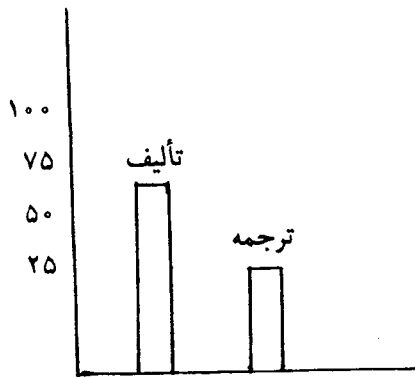
نمودار ۱: مقایسه تألیف / ترجمه

از مجموع ۴۱۶ مقاله و گزارش مندرج در مجلات کتابداری و اطلاع‌رسانی، ۲۷ مورد (۶۴/۹۰٪) تألیف و ۱۴۶ مورد (۳۵/۰۹٪) ترجمه است (نمودار شماره ۱).