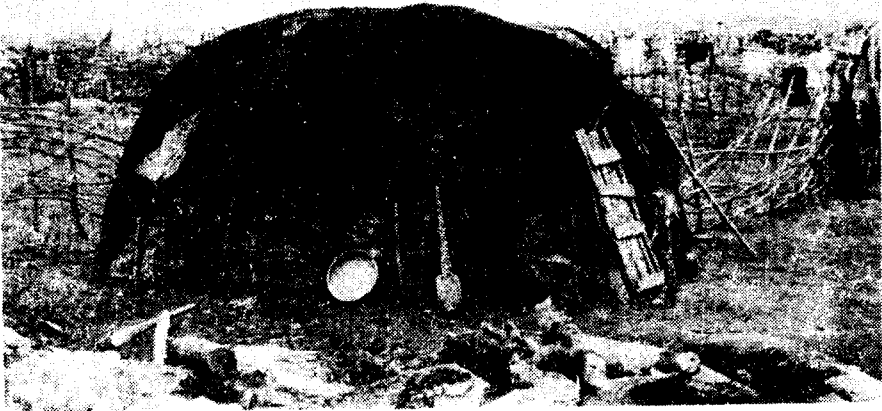
تصویر شماره ۱ - بالا : گوال - پاشین کومه