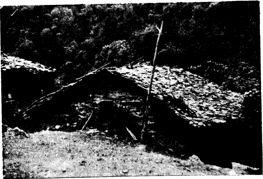
تصویر شماره ۳- وانه - ونه