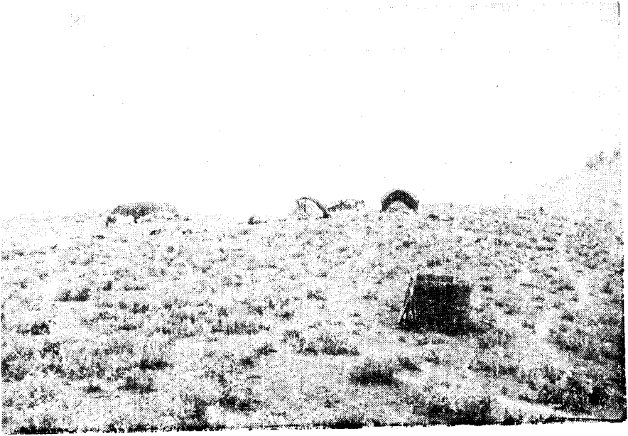
تصویر شماره ۲- پاری - پارو - پارگاه