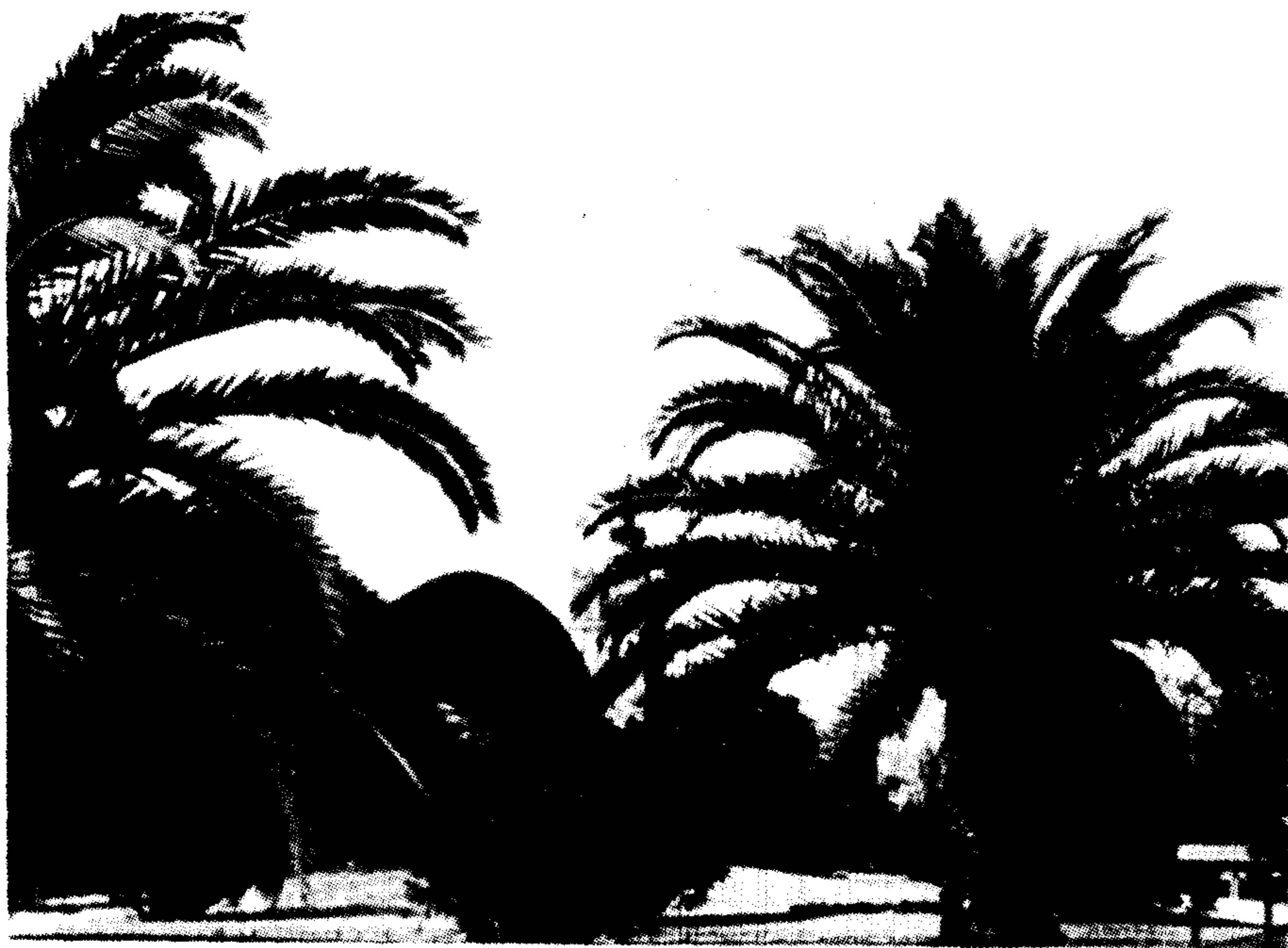
مرکز هماهنگی مطالعات محیط زیست

WORLD BANK. 1975. ENVIRONMENT AND DEVELOPMENT. WASHINGTON D.C.