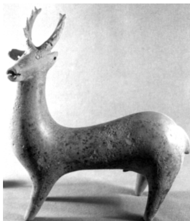
تصویر شماره (۲): مجسمه سفالین مجوف به شکل گوزن، قرمز آجری صیقلی شده، ۲۷/۵ × ۳۰ سانتی متر مارلیک، سده ۹ و ۸ ق.م، (حفاری های مارلیک، عزت الله نگهبان، انتشارات سازمان میراث فرهنگی کشور، تهران: ۱۳۷۸، ص ۵۰۸).