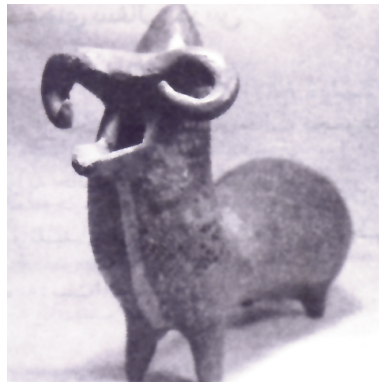
تصویر شماره (۱): مجسمه سفالین مجوف به شکل قوچ، سطح قهوه ای رنگ داغدار شده، ۲۹ × ۳۳ سانتی متر، مارلیک، سده ۹ و ۸ ق.م، (حفاری های مارلیک، عزت الله نگهبان، انتشارات سازمان میراث فرهنگی کشور، تهران: ۱۳۷۸، ص ۴۰۵).

بررسی آثار هنری سفالگران پیش از اسلام تاریخ ایران زمین حاوی مفاهیم ارزشمند و معرف نوع نگاهی پویا و تکامل یافته است، که ما را به بینش ژرف و توانمندی صنعتی و تکنیکی عمیق هنرمندانه ایشان رهنمون می سازد. اجازه بدهید به همین منظور با نگاهی امروزی نقبی به ارزش های انتزاع گرایانه سفالینه های جانوری بزنیم و یکبار دیگر طرز تلقی هنرمندان این گونه دست ساخته های سفالین را مرور کنیم.