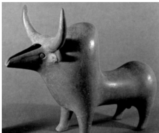
تصویر شماره (۵): مجسمه سفالین مجوف به شکل گاو، به رنگ قرمز پررنگ به ارتفاع ۱۸/۵ سانتی‌متر، مارلیک، سده ۹ و ۸ ق.م. (سفال و سفالگری در ایران، سیف‌الله کامبخش فرد، انتشارات ققنوس، تهران: ۱۳۷۸، ص ۵۱۸).

ریتم، تناسب، تزیین و ... است و نه صرفاً جنبه‌های کاربردی آن. در تصاویر (۱ و ۲ و ۳ و ۴ و ۵ و ۶) ریتم حرکتی حاصل از خطوط موج و سیقل‌یافته فرم بدن این موجودات به خوبی در هماهنگی کامل با تناسب و هم‌نوائی فرم‌های مثبت و منفی قرار گرفته و از این حیث چشم را با توده‌ای مواجه می‌سازد که در تعادلی پویا با فضای پیرامون خویش، رابطه‌فضا-زمانی، که از عمده مؤلفه‌های ارزشی مجسمه‌سازی دنیای معاصر می‌باشد را معنی می‌کند. سفالینه‌های جانوری حاوی نوع و کیفیت خاصی از مضمون و محتوی می‌باشند و به تعبیری شایسته‌تر شامل جنبه‌های فراگیری از معنا هستند. "این‌گونه اشکال نه همان اشیاء را به صورت انتزاعی نشان می‌دهند، بلکه جنبه عاطفی آن‌را نیز جلوه‌گر می‌سازد و چون بر عادات دینی مبتنی