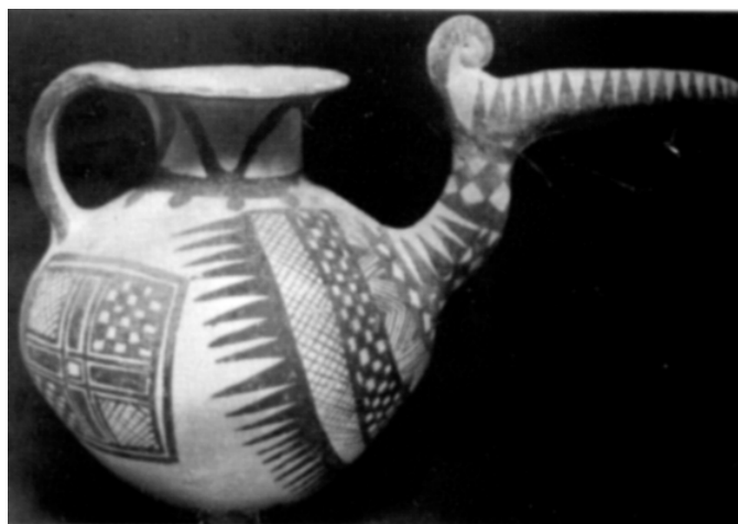
۷. تصویر شماره (۷): قوری مشابه به سر و منقار پرنده، نخودی رنگ، ۲۱/۵×۳۲، سی‌یلک، سده ۸ و ۹ ق.م. (سفال و سفالگری در ایران، سیف‌الله کامبخش فرد، انتشارات ققنوس، تهران: ۱۳۷۸، ص ۵۱۷).

با معرفی این حجم گسترده از سفالینه‌ها که اغلب در مکان‌های مذهبی و مکان‌های تدفین اجساد یافته شده و نسبت آن با مراسم آیینی کاملاً محرز و قابل اثبات است می‌توان به این نتیجه رسید که بخش اعظمی از سفالگری ایران در خدمت این گونه مراسم بوده است لذا انگیزه دیگری افزون بر جنبه‌های مصرفی و خانگی و تزیینی و زیبایی‌شناسی در سیر تحول سفال‌گری ایران شکل گرفته بود. نشانه‌شناسی مورد اخیر (انگیزه‌های مذهبی و آیینی) اطلاعات جامعی از نوع جهان‌بینی و انگاره‌های ذهنی معطوف به مسائل مربوط به اعتقادات و هستی‌شناسی انسان آن دوران به دست می‌دهد. امید است در فرصت‌های مناسب و تحقیق‌های بعدی به این مقوله مهم نیز پرداخته شود.