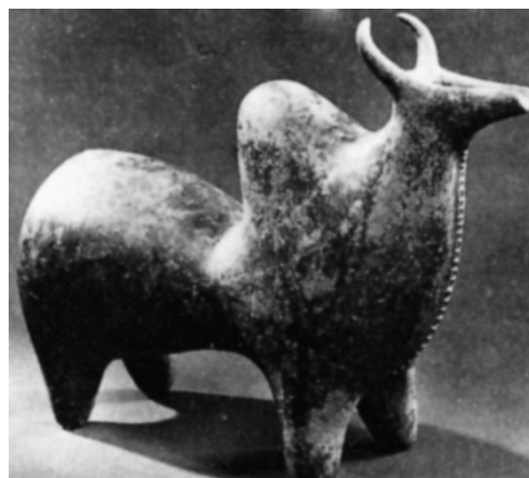
تصویر شماره (۴): مجسمه سفالین گاو کوهاندار، مکشوفه در جنوب غربی دریای خزر، سده ۹ ق.م. موزه متروپولیتن نیویورک، (هنرهای ایران، ر. دبلیو فریه، ترجمه پرویز مرزبان، انتشارات فرزاد روز، تهران: ۱۳۷۴، ص ۱۰).

آنچه یک "سفالینه با فرم جانوری" انتزاع‌گرایانه را از یک دست ساخته کاربردی صرف سفالین متمایز می‌گرداند، نوع توجه به ظرفیت‌های زیبایی‌شناسانه آن از جمله حرکت، پویایی،