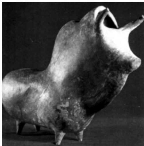
تصویر شماره (۶): مجسمه سفالین مجوف به شکل گاو، قرمز مایل به قهوه‌ای با پوسته درخشان، ۲۶/۵×۳۲/۵، املش، هزاره اول ق.م. (سفال و سفالگری در ایران، سیف‌الله کامبخش فرد، انتشارات ققنوس، تهران: ۱۳۷۸، ص ۵۱۸).

هنر قرن بیستم شکل گرفت که در پی آن هنرمندان قائل به این نظریه، بر این باور متفق القول اذعان داشتند. "هنرمند کسی است که به درون پنهان دنیای مادی نفوذ کند تا حقیقت معنوی ذات آنرا آشکار نماید" یا به تعبیر کاندینسکی: "ایده‌آل انتزاع، به امتیازات بیشتری دست می‌یابد" (کاندینسکی، ۱۳۷۹، ۹۵).