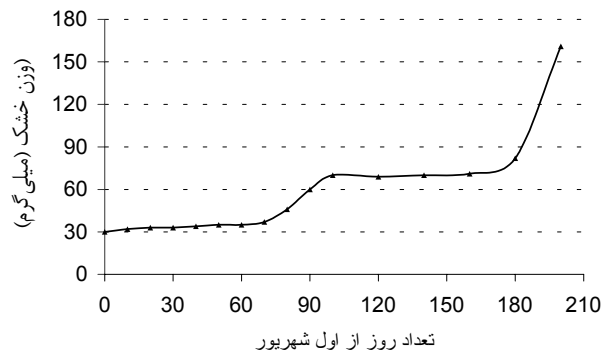
شکل ۲- تغییرات وزن تازه جوانه گل گل‌ابی شاه‌میوه از اول شهریور لغایت ۲۰ اسفند ماه

۶- در آخرین مراحل تشکیل اندام‌های گل، جفت‌های برچه‌ها در بخش فوقانی توده مریستم زایشی تمایز می‌یابند. زنجیر گل‌های گل‌ابی تحتانی است و لذا برچه‌ها از بالا به پایین ظاهر می‌شوند. بنابراین ابتدا با گود شدن مرکز مریستم گل، مادگی ساخته می‌شود و سپس خامه و کلاله که معمولاً پنج شاخه است تشکیل می‌گردد. خامه و کلاله در ابتدا به صورت پنج برجستگی در وسط کاسه گل به آسانی از پرچم‌ها قابل تشخیص است. تشکیل طرح‌های اولیه مادگی در این آزمایش از