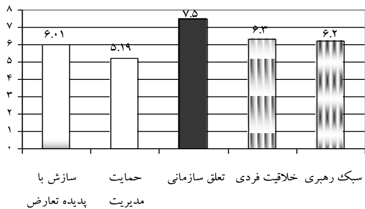
شکل 1_ خرده مقیاس های فرهنگ سازمانی در سازمان تربیت بدنی