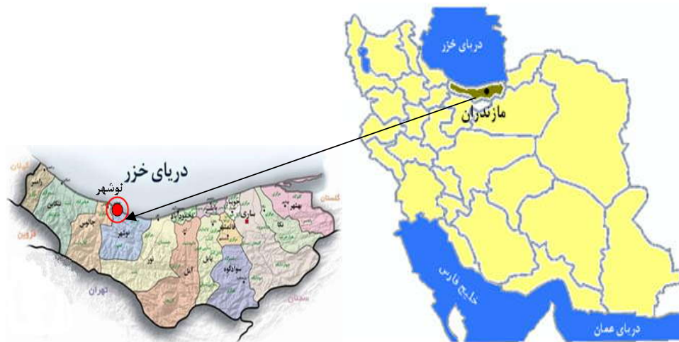
شکل شماره (۱): موقعیت جغرافیایی محل نمونه برداری