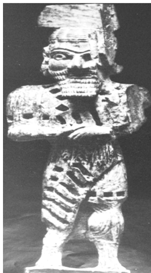
تصویر ۱۲- زیویه، انسان از عاج، دارای آرایش ریش، موزه تهران (قرن ۷ پ. م). ماخذ: (گیرشمن، ۱۳۷۱، ۱۰۰)