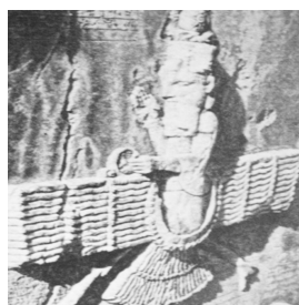
تصویر شماره ۱۰-، فروهر، بیستون. ماخذ: (گیرشمن، ۱۳۷۱، ۲۲۹)