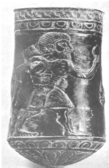
تصویر ۱۳- لرستان، لیوان مفرغ، دارای آرایش ریش، مجموعه بانو کریستین ر، هولمز (۸۰۰ پ. م).

با این حال عدم اختیار پیکره تراش قطعی "به نظر می‌رسد، اما در بعضی از قسمت‌ها اختیاراتی از طرف حجار دیده می‌شود، به نظر می‌رسد انتخاب گل‌هایی که در پلکان‌های شمالی ساختمان مرکزی حک شده‌اند. به اختیار حجاران واگذار شده‌است" (رف، ۱۳۷۳، ۶۱). احتمالاً در مورد تعداد جعد‌ها و یا جهت آنها نیز تا حدودی پیکر تراش مختار بوده است. آنچه گفته شد در مورد جزئیات صدق می‌کند و نه در مورد اصول کلی، کلیاتی که پایه گذار آن داریوش می‌باشد و از این رو همان طور که "رف" می‌گوید: "با آنکه کمان داران همگی مشابه یکدیگر هستند در جزئیات با یکدیگر تفاوت دارند" (همان، ۲۵). این مشابهت و کمی از یکدیگر کلتی است که هنر هخامنشی شکل دهنده آن بوده، و این تفاوت در جزئیات از طرف حجار صورت گرفته است که در تزیین آن دقت یا عدم دقت او را نشان می‌دهد که البته آنچه در بالا گفته شد در واقع بیانگر همان میزان آزادی عمل پیکره تراش می‌باشد گرچه "پیکره‌ساز آزادی محدودی در ابداع" (پوپ،