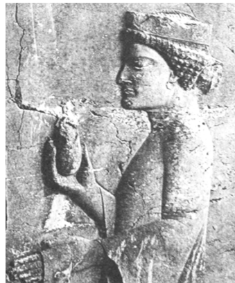
تصویر ۶- شاهزاده هخامنشی، تخت جمشید، سردیس بدون ریش. ماخذ: (گیرشمن، ۱۳۷۱، ۲۴۵)

افزون بر تخت جمشید در بیستون نیز همان سبک آرایش را برای شخص شاه شاهد هستیم. در مورد نقش شاه در بیستون باید گفت، علی‌رغم مرمت ۳ حین ساخت قسمت ریش، این قسمت ابتدایی‌تر و کم‌تر حرکت از تخت جمشید به نظر می‌رسد. مقایسه‌ی نمونه‌ی بیستون با تخت جمشید اندکی تفاوت در آرایش را نشان می‌دهد. در بیستون ریش داریوش کاملاً به شکل مستطیلی و قسمت دنباله ریش از نمای روبرو است. اما نمونه تخت جمشید به شکل نیم‌رخ است که در پرسپکتیو قرار گرفته، و دارای انحنا بوده، در قسمت پایین نیز از تراکم آن کم می‌شود.