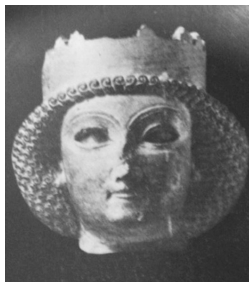
تصویر ۷- شاهزاده هخامنشی، تخت جمشید، سردیس بدون ریش.

خشایارشا بوده است" (سامی، ۱۳۴۸، ۹۲) (تصویر ۷). اگر تصویر کنیم که مجسمه‌ی موردنظر از آن خشایارشا باشد باید گفت هنرمند هخامنشی با نگاهی کاملاً واقع‌گرایانه - شاهزاده‌ی جوان را که به مقام شاهنشاهی نرسیده - همان گونه که بوده حجاری نموده است. شاهزاده مذکور جوان است و نسبت به نقشی که از خشایارشا در تخت جمشید داریم سن کمتری دارد. تمام نقوش موجود در تخت جمشید که نقش خشایارشا را نشان می‌دهد، کاملاً دارای ریش می‌باشد، و این نیز دلیل بر ولیعهدی اوست، که بیانگر رسیدن به جایگاه بالاتری است.