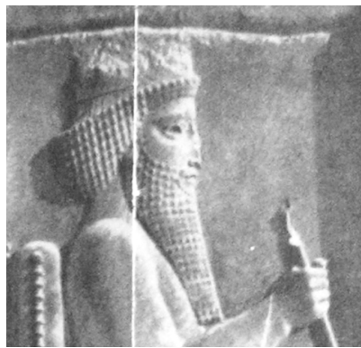
تصویر ۵- داریوش- تخت جمشید، کاخ خزانه.

خشایارشا بوده است" (سامی، ۱۳۴۸، ۹۲) (تصویر ۷). اگر تصویر کنیم که مجسمه‌ی موردنظر از آن خشایارشا باشد باید گفت هنرمند هخامنشی با نگاهی کاملاً واقع‌گرایانه - شاهزاده‌ی جوان را که به مقام شاهنشاهی نرسیده - همان گونه که بوده حجاری نموده است. شاهزاده مذکور جوان است و نسبت به نقشی که از خشایارشا در تخت جمشید داریم سن کمتری دارد. تمام نقوش موجود در تخت جمشید که نقش خشایارشا را نشان می‌دهد، کاملاً دارای ریش می‌باشد، و این نیز دلیل بر ولیعهدی اوست، که بیانگر رسیدن به جایگاه بالاتری است.