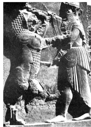
تصویر ۹- تچر درگاه شرقی تالار اصلی، نبرد شاه با موجود افسانه‌ای. ماخذ: (همان، ۶۴)