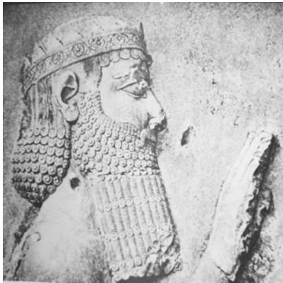
تصویر ۴- داریوش، بیستون. ماخذ: (همان، ۲۳۶)