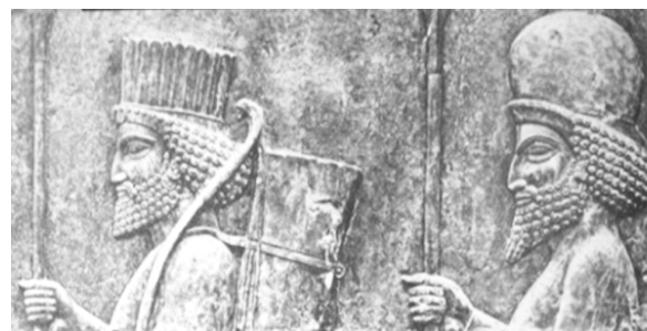
تصویر ۲- پلکان کاخ سه دروازه، نگاهبانان مادی و پارسی.

در این گروه هنرمند تصاویر را به واقعیت نزدیک نموده و حالت طبیعت‌گرایانه نقوش حفظ می‌شود، لذا سکایی با حبشی... متفاوت است و هر هیئت خصوصیتی دارد که بتوان از هیئت دیگر متمایز دانست. "وسيله عمده و اصلی تشخیص میان اقوام و مردم گوناگون انواع مو و لباس است" (هرتسفلد، ۱۳۸۱، ۲۷۸). از این رو "در این نقش‌ها همیشه سعی بر این بوده است که با تکیه بر اختلاف در شیوه‌های آرایش مو، اقوام و ملت‌ها از یکدیگر تمیز داده شوند" (همان، ۲۷۳). این تغییرات هرچند اندک است، اما پیکرتراش تلاش دارد، بتوان آنها را از هم تفکیک نمود و در واقع هر نقش تداعی کننده قومی باشد که متعلق به منطقه‌های خاص است. با توجه به موقعیت جغرافیایی هر قوم سعی شده که چهره متناسب با آن منطقه باشد. لذا بطور مثال: سکایی مویی لخت و حبشی مویی مجعد دارد و یا در مورد سایر نقوش نیز می‌توان این تفاوت‌ها را در چهره - با توجه به منطقه جغرافیایی - مشاهده نمود. در این گروه هم ریش مجعد است و هم لخت... تنوعی که در مقایسه با سایر گروه‌ها بیشتر می‌باشد، از این گروه می‌توان نمونه‌هایی از پلکان شرقی و شمالی آپادانا را مثال زد. گروه دوم، سربازان و نگاهبانان: علی‌رغم این که همه دارای ریش مشابه می‌باشند اما این نوع ریش نسبت به سایر گروه‌ها کوتاه‌تر