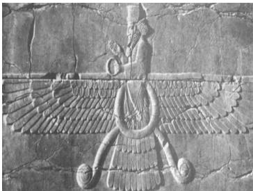
تصویر شماره ۱۱- فروهر، تخت جمشید. ماخذ: (همان، ۱۹۹۰)

بدون شک هریک از نقوشی که از داریوش به جا مانده دارای ریش می‌باشد، آن هم با آرایش ویژه‌ای که دارد باعث تفاوت وی با سایر نقوش می‌شود. باتوجه به این که شاه شخص اول بوده و از مقام مادی و معنوی بالایی برخوردار است، آرایش ریش تکامل‌یافته‌تری دارد. ریش او از سایر افراد بلندتر است، بنابراین به حتم داشتن ریش بی‌ارتباط با جایگاه نمی‌باشد. دللی دیگر برای اثبات این نظر که ریش داریوش نشانه معنویت و جایگاه او می‌باشد؛ یکسانی نوع ریش بین داریوش و فروهر است که مبین ارتباط معنوی این دو می‌باشد. ریش شاه مانند فروهر می‌باشد به نوعی می‌توان گفت شاه به واسطه ریش ممتازتر است. جالب اینجاست که نوع آرایش ریش فروهر در بیستون همانند داریوش مستطیلی می‌باشد (تصویر ۱۰). از طرفی در تخت جمشید نیز آرایش ریش فروهر و داریوش کاملاً مشابه یکدیگر می‌باشد (تصویر ۱۱). این خود دلیلی بر ارتباط شاه با نیروهای مافوق طبیعی و معنوی می‌باشد. قدرت نیز عامل موثر در نوع آرایش بوده با توجه به گروه‌بندی که برای هریک از نقوش تخت جمشید داده شده هرکه قدرت و جایگاه بالاتری داشته تزیینات بیشتری در آرایش ریش او دیده می‌شود.