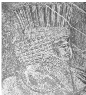
تصویر ۳- تخت جمشید، پلکان شرقی آپادانا، منصف‌دار پارسی. ماخذ: (همان، ۱۸۰)

گروه چهارم، شاهان: این گروه از نقوش حالت اختصاصی‌تر می‌یابند، یعنی چهره‌های که مطمئناً انحصاری و مختص شخصی خاص است، و کامل کننده دو نمونه قبلی (سربازان و اشراف زادگان) است. در نقش شاهان - که از این آرایش استثنائی برخوردارند - زیر گونه و روی چانه همان جعد‌هایی است که درباره سربازان بوده و قسمت دومی همانند اشراف زادگان شده با این تفاوت که این قسمت در این گروه لخت و یکنواخت نیست و دقت بیشتری صرف خلق آن شده است. می‌توان گفت تفاوت به معنای واقعی اتفاق افتاده و اوج هنر پیکرتراشی در ترسیم چهره‌ی شاهان بکار رفته است، در نمونه‌های موجود از شاهان در تخت جمشید، مانند: داریوش، خشایارشا، اردشیر، هر سه از جهت آرایش ریش مشابه یکدیگرند و یک شیوه‌ی خاص اعمال شده است، در نقش برجسته‌های شاهان، انتهای ریش زیر چانه سه ردیف جعد دوگانه و یا منفرد دیده می‌شود.