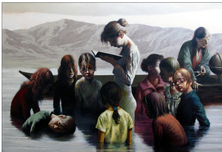
تصویر شماره 5

در تبیین جامعه‌شناختی چنین مفاهیم و تفاسیری که از اثر به دست دادیم - همانند اثر قبلی - محیط غیرمعمول زیست و تجربه‌ی فیگورهای انسانی قابل توجه می‌نماید. در تصویر «تجربه‌های روزمره»ی زندگی چون آموزش، تکامل و بلوغ افراد به قدری طبیعی و بی‌واسطه می‌نماید که تعارضی سخت با پیرامون نامعمول آن به وجود می‌آورد. تعارضاتی صلب و سخت که ذهن را به سمت تجربه‌های ناقص و ناکامل، اما گریزناپذیر زندگی هدایت می‌کند. تجاری که با همه‌ی نواقص و تعارضاتش، حتی در شرایط غیرمعمول و نابهنجار اجتماع مان همچنان با قدرت به زیست خود ادامه می‌دهند. در حضور جغرافی‌دان نیز شاید بتوان تأثیرات غرب و تجدد بر اذهان و سبک زندگی و حتی غربی‌بودن شکل آموزش مدرسه‌ای را نیز پی‌گیری کرد؛ چنانچه تجدد ما در آغاز خود و در تصویرش در نقاشی کمال‌الملک نیز وامدار باروک است. تصویر 2 (1389): سه جراح را در حالت‌های مشابه در حالی که گویی مشغول جراحی‌اند در مقابل سه تلویزیون می‌بینیم، اما مشخص نیست جراح‌ها چه چیز را جراحی می‌کنند. تصویری