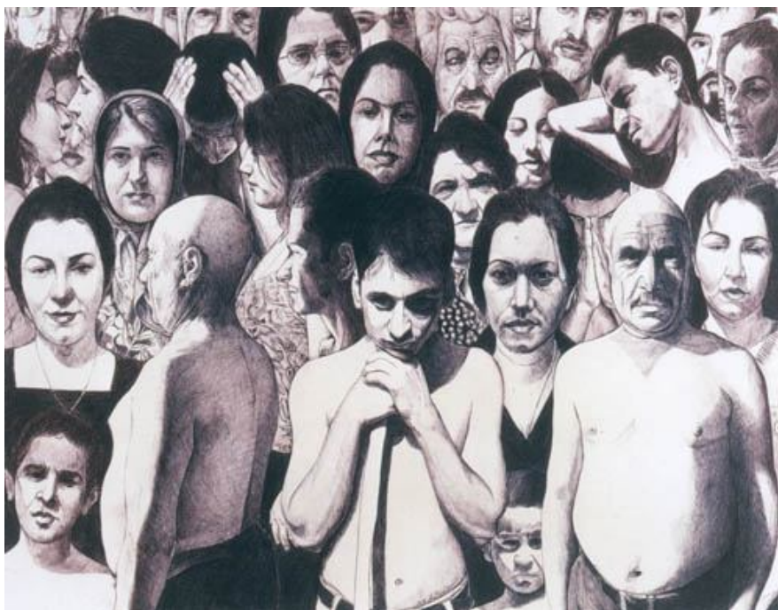
تصویر شماره 1

تصویر 1: سطحی مملو از فیگورهای متراکم انسانی که هر یک به دقت شخصیت‌پردازی شده‌است. بی‌شکلی و تراکم این توده‌ی انسانی حس خفگی ناخوشایندی متبادر می‌کند؛ حسی که البته در چهره‌ی خود فیگورها مشاهده شدنی نیست. هیچ ارتباط ملموسی بین افراد به مثابه عناصر تصویر و هم‌چنین اجزای یک کل واحد که از فضای کلی تأثیر می‌گیرند وجود ندارد؛ طوری که گویی هر یک فارغ از دیگران، در عوالم جداگانه‌ی خویش سیر می‌کنند. یگانه‌ی خاصیت وحدت‌بخش تصویر وجود منبع نوری واحد است که حس بودن در فضایی واحد را به‌وجود می‌آورد. شخصیت‌پردازی افراد البته چهره‌هایی کاملاً ملموس و مادی و روزمره آفریده که هر یک به راحتی حس همذات‌پنداری مخاطب را برمی‌نگیزد.