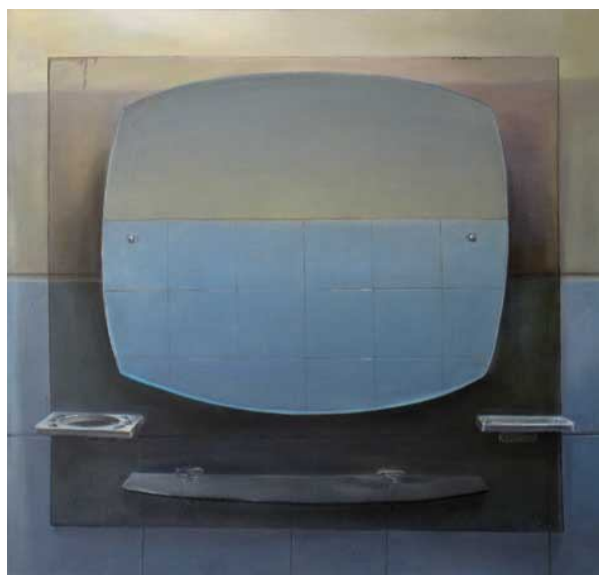
تصویر شماره 4

پرفراز و نشیب‌تر. این قاب گویی مخاطبی با حافظه‌ی مشترک را به درون تصویر فرامی‌خواند و او را در برابر آینه‌ای از زیست‌اش قرار می‌دهد. آینه همچنین نشانه‌ای است که دلالتی بر خودانتقادی دارد. این کار بر خلاف اکثر آثار افسریان عمق کمی را می‌نماید و حتی تصویر دیوار مقابل، که به واسطه‌ی انعکاسش در آینه به پلانی جلوتر منتقل شده است، به شدت از همین عمق کم نیز می‌کاهد و بیننده را در برابر دیواری سخت با تصلبی ناگوار مواجه می‌کند. این سختی انتظار کسی را می‌کشد که به واسطه‌ی حضورش به دلالت آینه معنا دهد. تصلبی که دور نیست تا آن را به سنت و اندیشه‌ای نسبت دهیم که به واسطه‌ی تکرار اشتباهاتمان با تصلب بیشتر مواجهش می‌کنیم. این ناگواری را چاره‌ای نیست جز آنکه خود را در قاب خودانتقادی تصویر زندگی‌مان ببینیم.