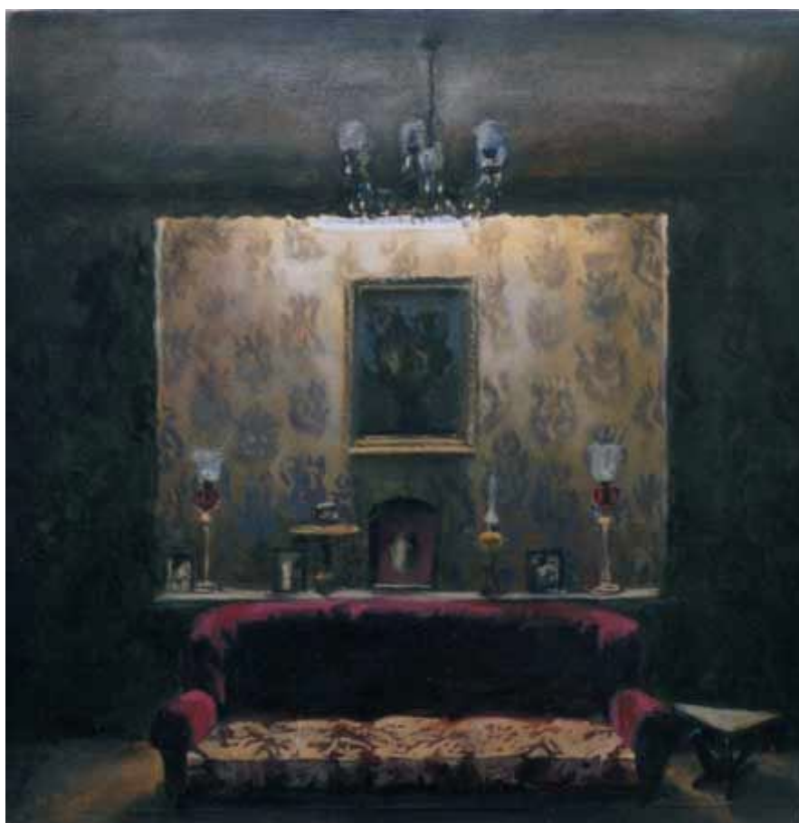
تصویر شماره 3

تأمل برانگیز است. این ترکیب‌بندی با استفاده از قرینگی و خطوط ایستای عمودی و افقی سکون و آرامش تصویر را بیشتر نیز می‌کند.