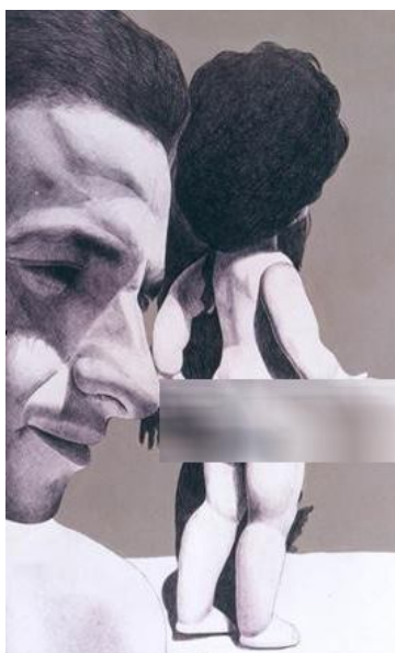
تصویر شماره 2

موانعی بر سر راه تجربه‌ای کامل و بی‌واسطه از زندگی و بلوغ و تکامل ایجاد کرده و دغدغه‌هایی که در ذهن و زندگی فرد می‌آفرینند. زنانی که شرایط از جسمیت‌شان موجودیتی عروسک‌گونه آفریده و جسمیت‌شان تنها ویژگی جنسیت‌شان تلقی می‌شود و مردانی که چون قربانیان این شرایط از تجربه‌ی زندگی و بلوغ و تکامل وامی‌مانند، چنانکه چون کودکانی نابالغ، حسرت بازی را با خود تا دوران بزرگسالی حمل می‌کنند و امکان رشد و تجربیاتی کامل‌تر را نیز از دست می‌دهند.