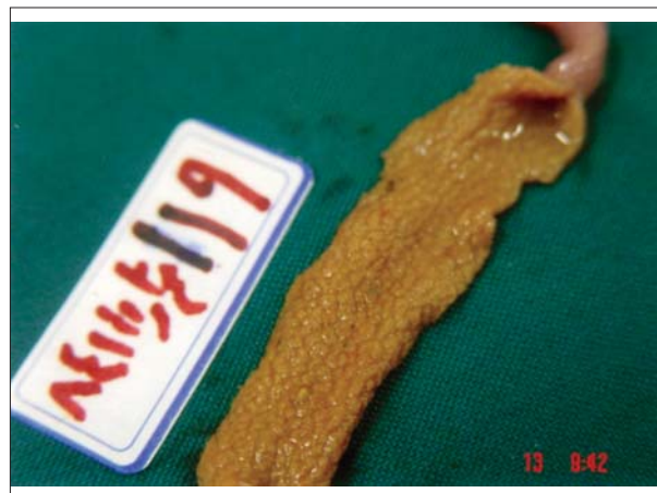
تصویر ۱- وجود مناطق وسیع نکروز در ناحیه ژژنوم پرنده تلف شده.

تعداد تلفات در گروه چالش ای که جیره حاوی ۴۰ درصد پودر ماهی را دریافت کرده بود به مراتب بیشتر بود. این تفاوت در تعداد تلفات از لحاظ آماری نیز قابل توجه بود. در کالبدگشایی پرندگان تلف شده ناشی از آنتریت نکروتیک، ضایعات تیپیک بیماری بیشتر در ناحیه ژژنوم ملاحظه گردید، اگر چه در مواردی ضایعات بیماری در ناحیه دئودنوم روده نیز آشکار بود.