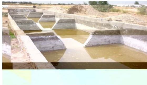
شکل ۲. تصویر چاهک و استخر ذخیره آب در روستای کفتارگی ۱ شهرستان زهک