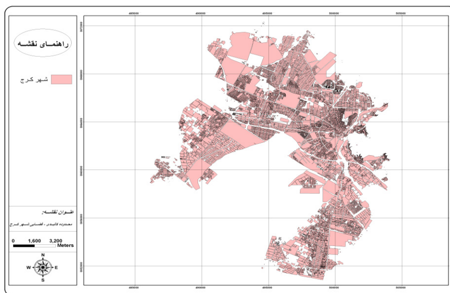
شکل ۱. نقشه‌ی کالبدی - فضایی شهر کرج

شناخت تاریخی پدیده، سنگ زیربنای شناخت وضع موجود است و درک درست از شرایط موجود تخمین دگرگونی‌های بعدی پدیده را ممکن می‌سازد (حییبی، ۱۳۸۴). قدیمی‌ترین منابع که نام کرج در آن به میان آمده کتابی معروف به نزهة القلوب است که در سال ۷۴۰ هجری قمری به دست حمداله بن ابی‌بکر بن نصر مستوفی (حمدالله مستوفی) تألیف شده است. در این کتاب نام کرج در ضمن ولایات عراق عجم از توابع طالقان آمده و نوشته شده است که در این ولایت ده‌های معتبر بوده است. ممکن است نام کرج و رودخانه کرج از واژه‌ی "گود" که در اوستا به عنوان یکی از شعبات رنگ‌هاست، گرفته شده باشد که پس از سال‌های دراز، اینک به صورت کرج درآمد است. در حالی که اگر از واژه‌ی کراج به معنی بانگ و فریاد گرفته شده باشد، در این صورت نیز با سابقه‌ی باستانی آن ارتباط پیدا می‌کند؛ زیرا در تپه‌ی آتشگاه و کوه‌های مراد تپه و کلاک و قلعه‌دختر شهرستانک در ایام باستان برای خبر رسانیدن و دیده‌بانی آتش‌افروزی می‌شد و بدین طریق هجوم دشمن را به یکدیگر خبر می‌دادند. به احتمال کرج مبدأ خبری بزرگی جهت رگا (ری) بوده و از آن رو ممکن است که در اصل کراج بوده باشد (نیلوفری، ۱۳۴۴).