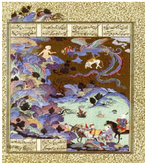
تصویر ۵: دیدار زال با کاروانیان - شاهنامه طهماسبی (اعظم کبیری و دیگران، ۱۳۸۸).

شاهنامه طهماسبی شاهکار نگارگری ایران در مکتب تبریز صفوی می‌باشد که به دست خواجه عبدالعزیز مصور گردیده است. نگاره «دیدار زال با کاروانیان» (تصویر شماره ۵) از شاهنامه طهماسبی، روایتی مصور از داستان زال است؛ مهم‌ترین ویژگی این نگاره تسلط فضای طبیعت بر فرهنگ است.