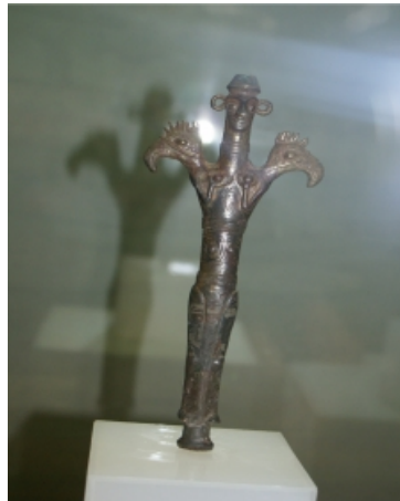
تصویر ۳: تندیس مفرغی الهه مادر، مربوط به ۱۳۰۰-۷۰۰ ق. م. موزه فلک‌الافلاک لرستان.

الهه مادر نه تنها تولد اعضای جدید جامعه را بر عهده داشت، بلکه تولد مجدد مردگان در دنیای دیگر نیز از توانمندی‌های او محسوب می‌شده است. در ناحیه Joches در فرانسه، تصویر یک پیکرک نوسنگی، بر دیواره سردابه‌ای که محل دفن مردگان نیز بوده است، به چشم می‌خورد و چون این تصویر از اتاق دفن مردگان به دست آمده است، می‌توان این گونه استدلال نمود که تفکر رایج در آن زمان بر این دیدگاه استوار بوده است که مردگان نه در خاک، بلکه در رحم مادر جهانی دفن می‌شوند، در آن‌جا دوباره رشد می‌کنند تا مجدداً از طریق رحم همین مادر در دنیای جاودانگی متولد شوند. بر این مینا، اتاق دفن، حکم زهدان مادر و الهه مادر نیز حکم خالق انسان را داشته است (مرکل ۴ ، ۱۹۹۹: ۶۴). همچنین وجود برخی از پیکرک‌ها در داخل ظروف غله، مثلاً در محوطه چاتال هویوک ترکیه، می‌تواند بیانگر این مطلب باشد که الهه مادر قادر است مردمان خود را با دادن غلات و محصولات کشاورزی سیر کند و چون در محوطه چای اونوی ترکیه نیز تصاویر گیاهی همراه با الهه مادر یافت شده، می‌توان این‌گونه برداشت کرد که این الهه دارای تقدس گیاهی و در ارتباط با کشاورزی بوده است (تات ۵ ، ۲۰۰۵: ۹۳). نقش الهه مادر به وفور بر روی آثار مفرغی لرستان نیز به تصویر درآمده است (تصویر شماره ۳).