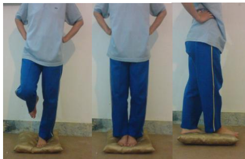
شکل ۱- اجرای آزمون BESS در سه وضعیت ایستادن روی دو پا

ارزیابی تعادل ایستا: تعادل ایستا به وسیله آزمون ارزیابی خطاهای تعادل ۲ (BESS) ارزیابی شد. در این آزمون، شش وضعیت مختلف که شامل سه وضعیت ایستادن (ایستادن روی دو پا، ایستادن به صورتی که یک پا در جلو و پای دیگر در عقب قرار دارد و ایستادن روی یک پا) بر روی دو سطح نرم و سخت بود در نظر گرفته شد. در هر وضعیت چشم‌های آزمودنی‌ها بسته بود و دست‌های آنها بر روی کمر قرار داشت. آزمودنی هر وضعیت را به مدت ۲۰ ثانیه انجام می‌داد و تعداد کل خطاهایی که در این شش وضعیت مرتکب می‌شد به‌عنوان نمره آزمودنی محاسبه شد. خطاها عبارت بودند از: دست‌ها از کمر جدا شوند، چشم‌ها باز شوند و یا تعادل به هر دلیل به هم بخورد. قبل از اجرای آزمون، آزمودنی ۳ بار آزمون را انجام دادند تا با سطوح آزمون آشنا شوند (۲) (شکل ۱).