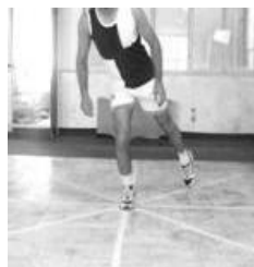
شکل ۲ - آزمودنی در حال اجرای آزمون SEBT (جهت خلفی داخلی)

ارزیابی تعادل پویا: تعادل پویا به وسیلهٔ آزمون تعادلی ستاره ۱ (SEBT) ارزیابی شد. برای اجرای آزمون تعادلی ستاره، یک ستارهٔ هشت وجهی در جهات قدامی، قدامی داخلی، داخلی، خلفی داخلی، خلفی، خلفی خارجی، خارجی و قدامی خارجی بر روی زمین ترسیم شد. آزمودنی با یک پا در مرکز ستاره می‌ایستاد و با پای دیگر سعی می‌کرد حداکثر عمل دستیابی را در هر هشت جهت انجام دهد و به نقطهٔ شروع برگردد بدون اینکه تعادل بهم بخورد. آزمودنی هر جهت را ۳ بار تکرار می‌کرد و میانگین آن به عنوان نمرهٔ خام تعادل پویا در نظر گرفته شد. طول پا (فاصلهٔ بین خار خارهای قدامی فوقانی تا قوزک داخلی پا) برای نرمال کردن نمرات خام تعادل پویا (فاصلهٔ عمل دستیابی بر حسب سانتی‌متر تقسیم بر طول پا ضرب در ۱۰۰) استفاده شد و در محاسبات آماری استفاده شد (۱۰) (شکل ۲).