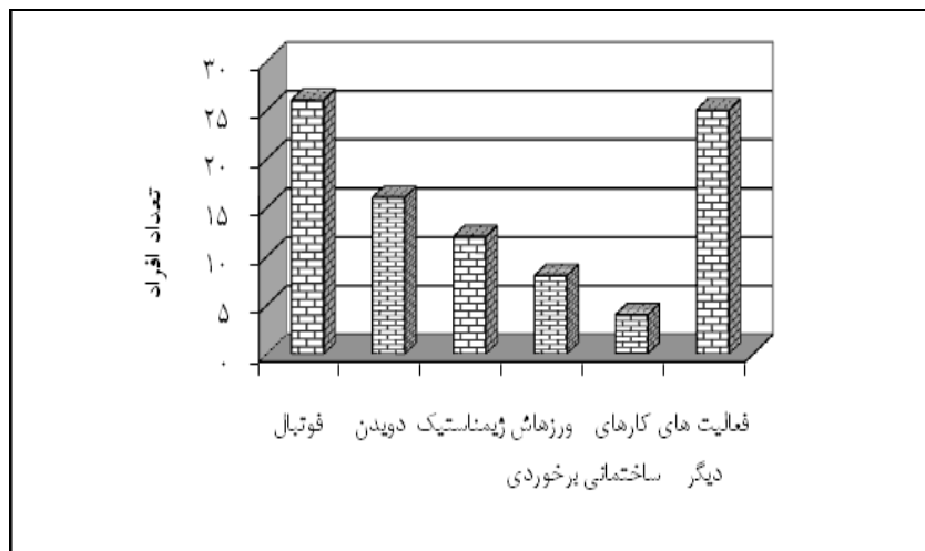
شکل ۲- تعداد افراد شرکت کننده در فعالیت های مختلف در گروه مستقل از زمینه