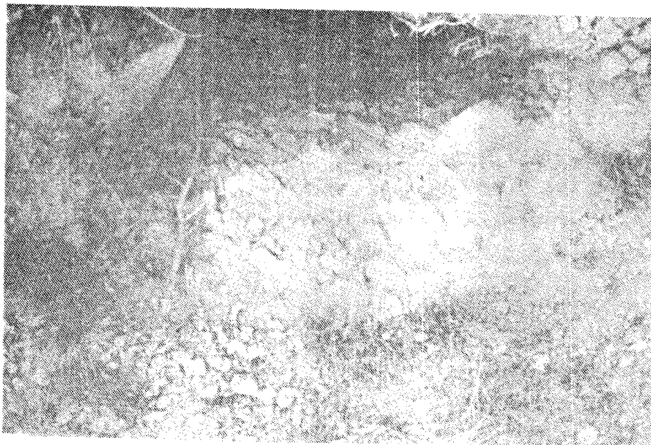
تصویر شماره ۳ - پروفیل خاک کنار درمنه در تپ گیاهی شماره ۷.