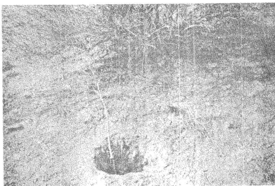
تصویر شماره ۴ - پروفیل خاک کنار Amygdalus scoparia در تپ گیاهی شماره ۳.