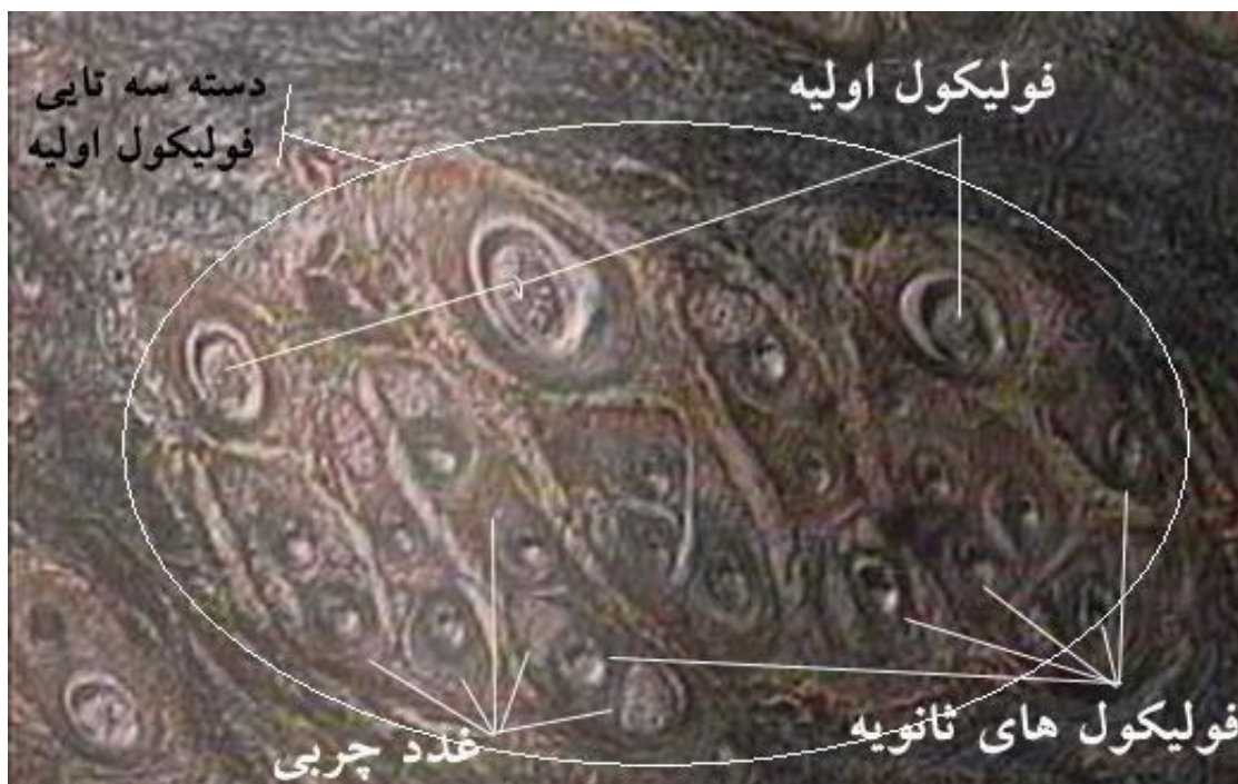
شکل 2 - مقطع عرضی پوست بز ماده مرخز در مرحله چهارم نمونه برداری (سن 42 روزگی). یک دسته سه تایی فولیکول اولیه و تعداد متغیری فولیکول ثانویه (رنگ آمیزی ساکیک - بزرگ‌نمایی 100)