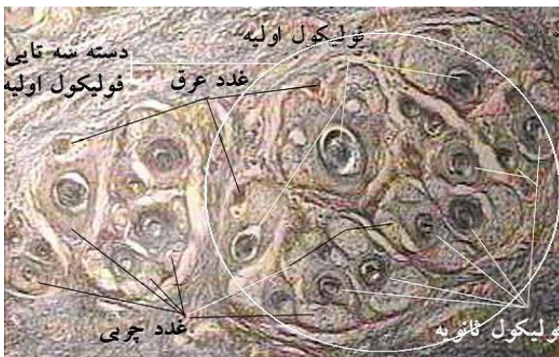
شکل 1 - مقطع عرضی پوست بز مرخز در مرحله سوم نمونه برداری (سن 28 روزگی). یک دسته سه تایی فولیکول اولیه و چندین فولیکول ثانویه (رنگ آمیزی ساکیک - بزرگ نمایی 100)

ثانویه موجود در پوست بز مرخز در دو هفته اول زندگی را نشان می‌دهد. در بزهای آنقوره نسبت S/P در زمان تولد برابر با دو و در زمان بلوغ کامل کلیه فولیکول‌های ثانویه پوست در سن سه ماهگی، در حداکثر مقدار خود یعنی هشت تا نه گزارش شده است (4). نسبت S/P در بزهای تولیدکننده کشمیر در سن دو هفتگی 4/76 و حداکثر آن در سن 20 هفتگی برابر با 6/66 گزارش شده است (6). بلوغ فولیکول‌های ثانویه و نسبت S/P پس از سن دو هفتگی، در حیوانات مختلف با سرعت متفاوت ادامه می‌یابد تا در سن