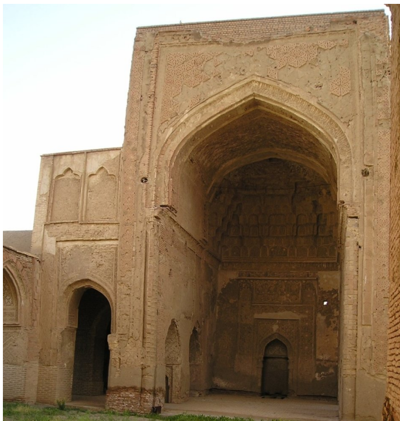
تصویر ۱۳، نمای ایوان جنوبی مسجد جامع فریومد (نگارنده، ۱۳۸۶).

چهار نوار موازی که با آجرهای معرق و سفالکاری (گل پخته) قالب‌ریزی شده در طرفین ساخته شده است، نوار اصلی یا نوار بزرگ متشکل از یک ردیف شش گوشه است که از بخشهای مجزا در کارگاه ساخته شده، ابعاد هر یک از شش گوشه‌ها ۴۲ سانتی‌متر است و متشکل از چهار قسمت مربع شکل است. بر زمینه این شش گوشه، احتمالاً نیم کره‌ای به شکل برجسته و آجری داشته نظیر همان‌ها که در تزیینات نواری زیر طاق جناغی ایوان قرار دارد. به احتمال فراوان وسط شش گوشه‌ها را با طرحهای تزیینی سفالکاری قالب‌گیری شده ساخته‌اند که اکثر نقش‌ها ستاره‌ای شکل بوده و شبیه آنهایی است که در وسط شش گوشه‌های نوار حاشیه ایوان شمالی وجود دارد. دو نوار مجاور در پیرامون نوار تزیینی اخیرالذکر، از اجزاء مستطیلی شکلی به ابعاد ۹/۵ ۱۸/۵ سانتی‌متر که با کمک قالب‌ریزی از گل پخته شده است. نوار چهارم حاوی طرحی تزیینی است، یادگاری از زمینه کتیبه‌های کوفی دوره سلجوقی که رباط شرف ساخته شده است. در این چهار نوار که