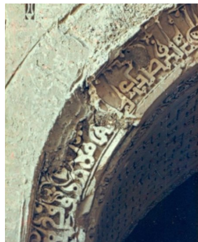
تصویر ۷ و ۸، کتیبه‌های خط کوفی با دو نوع خط از دو دوره و کتیبه داخل ایوان (نگارنده، ۱۳۸۶).