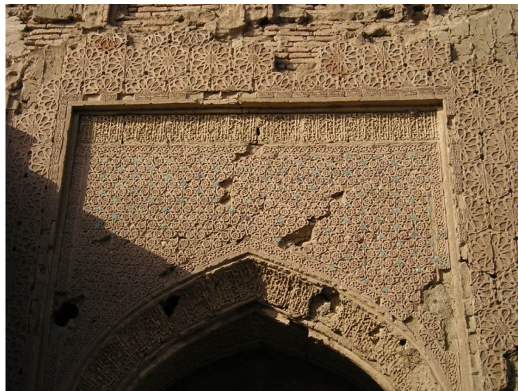
تصویر. کتیبه خط کوفی تزیینی و آیات قرآنی جنب ایوان شمالی مسجد جامع فریومد.

در قسمت انتهایی ایوان شمالی در زیر سقف آن همانند ایوان جنوبی با مقرنس‌های آجری ساخته شده است که تزیینات گچبری زیبا بر روی آن کار شده که متأسفانه بیشتر آنها خراب شده است. پوشش ایوان شمالی همانند ایوان جنوبی است، یعنی با روش طاق و تویزه پوشیده شده است و زیر طاقها را با تزیینات گچبری هندسی و گیاهی که وسط آنها را یک نیم کره برجسته گچی پر کرده است. در سمت چپ ایوان شمالی نیز مدخلی که راه ورودی به اتاق سمت چپ ایوان شمالی قرار دارد. در پیشانی قوس جناغی این مدخل کتیبه‌ای به خط کوفی وجود دارد، گچبری شده است، که متأسفانه بخشهای عمده آن خراب شده است. زیر طاق با تزیینات گچبری با طرحهای هندسی و گل و گیاه پر شده است. در پشت بغل قوس تزیینات تلفیق کاشی فیروزه‌ای سفالکاری ساخته شده است. در بالای این تزیینات کتیبه‌ای افقی به خط کوفی تزیینی گچبری شده که حاوی آیات قرآنی است که با کتیبه خط کوفی سمت راست ایوان شمالی مشابه و قرینه است. در بالای این قسمت نیز تزیینات شش ضلعی‌ها و دو طاق‌نمای با قوس ضربی قرار دارد، ساخته شده است (تصویر ۱۸).