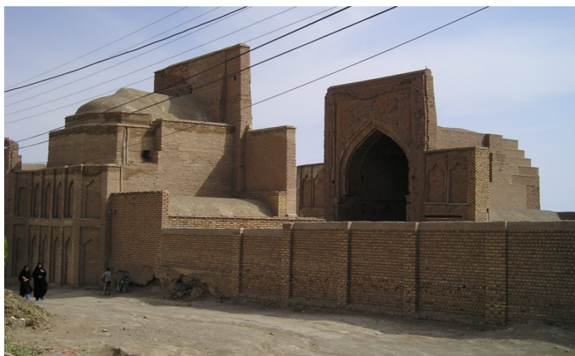
نمای عمومی مسجد جامع فریومد.

مسجد فریومد دارای بخش‌های مختلفی همچون: ایوان جنوبی یا اصلی، ایوان شمالی، رواق‌های شرقی و غربی، مدخل ورودی (ایوان ورودی) فضاهای پیرامون ایوان‌ها، که این فضاها به صورت قرینه در طرفین ایوان‌ها ایجاد شده است. بر اساس شواهد و وضعیت موجود بنای مسجد، در دوره‌های مختلف تغییر و تحولات مهمی در آن بوجود آمده است. این بنا به دلیل داشتن آرایه‌های گونه‌گون و گسترده به عنوان گنجینه‌ای از تزئینات و عناصر معماری اسلامی محسوب می‌شود و با دارا بودن ویژگی‌های معماری «سبک خراسانی» (پیرنیا، ۱۳۷۹: ۱۰)، و کتیبه نگاری از دیدگاه مطالعات باستان‌شناختی دوره اسلامی حائز اهمیت است.