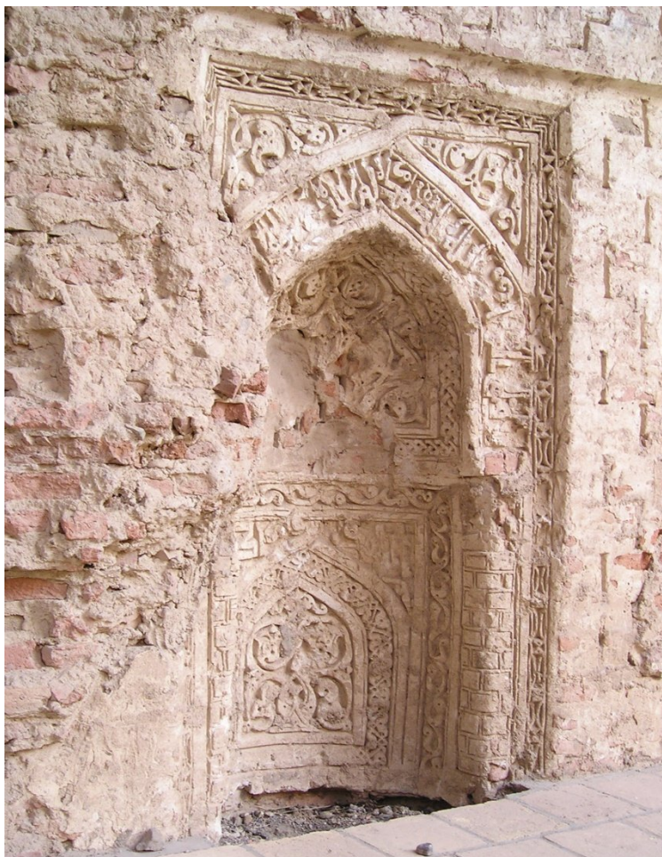
تصویر ۶، محراب کوچک داخل پایه دیوار ایوان اصلی (نگارنده، ۱۳۸۶).

عریض، ریزش‌ها و حتی جابجا شدن‌های چشمگیری در آن اتفاق افتاده است. شایان ذکر است که در چند دهه اخیر هنگام مرمت مسجد یکی از درگاه‌ها را که در آن محرابی گچبری شده قرار دارد باز نموده‌اند (تصویر ۶).