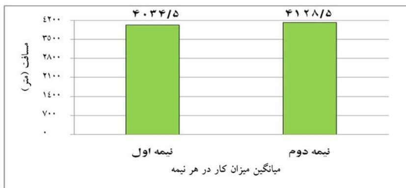
شکل ۱- مقایسه میانگین مقدار کار (به واحد متر) نیمه‌های اول و دوم (نیمه‌های اول و دوم دو نیم فصل اول و دوم)

یافته‌های پژوهش در شکل ۱ با مقایسه میانگین مقدار کار دو نیمه داوران، افزایش مقدار کار و مسافت طی شده در نیمه دوم مسابقات را نسبت به نیمه اول نشان می‌دهد، هر چند این افزایش از نظر آماری معنادار نیست ( P=0/255 ). علاوه بر این، یافته‌های پژوهش در شکل ۲ تفاوت تغییرات درصدی مقدار لاکتات، ضربان قلب و مقدار کار داوران بین دو نیمه را در طی دو نیم فصل نشان می‌دهد.