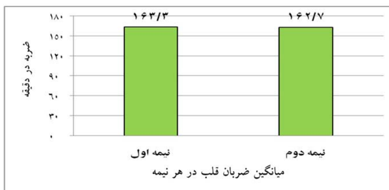
شکل ۳- مقایسه میانگین ضربان قلب (تعداد در دقیقه) نیمه‌های اول و دوم (نیمه‌های اول و دوم دو نیم فصل اول و دوم)

یافته‌های پژوهش حاضر در شکل ۳ نشان می‌دهد میانگین ضربان قلب نیمه دوم داوران نسبت به میانگین ضربان قلب نیمه اول کاهش یافته است، هر چند این کاهش از نظر آماری نسبت به میانگین ضربان قلب نیمه دوم معنادار نبود ( P=0/474 ). مقدار این کاهش (۰/۳۶- درصد) در شکل ۲ مشخص شده است.