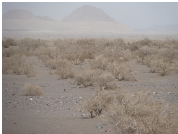
شکل ۱- نمایی از تاغ‌زارهای طبیعی در منطقه حفاظت شده سیاه‌کوه