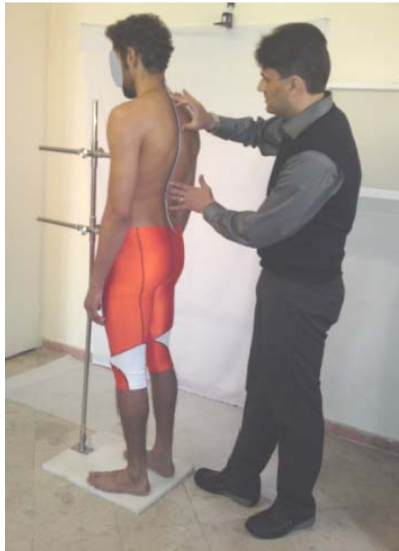
شکل ۲_ اندازه گیری کایفور سینه ای بوسیله خط کش منعطف