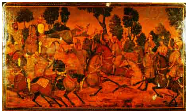
تصویر ۸- نقاشی روغنی پشت جلد شاهنامه موسوم به میرزا صالح، نسخه شماره ۲۲۵۰، متعلق به کاخ موزه گلستان، تهران.

نخستین صفحه در ورق اول بعد از جلد دارای دو یادداشت مختصر در بالا و پایین است؛ در گوشه بالا سمت چپ با مداد یادداشت شده است: no: 1352 و گوشه پائین سمت چپ با