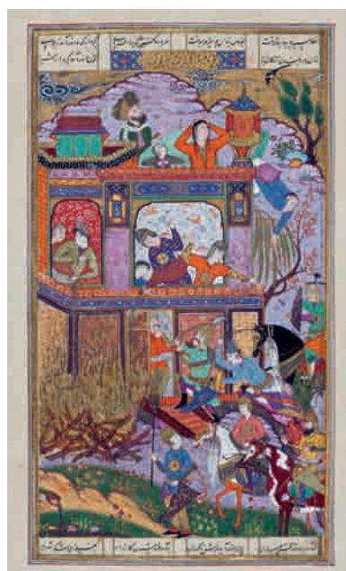
تصویر ۳- رزم کیخسرو با افراسیاب و گرفته شدن گنگ دژ، ۱۳۷ × ۲۵۰ مم. شاهنامه شاملو، کتابخانه کاخ موزه نیاوران، تهران.