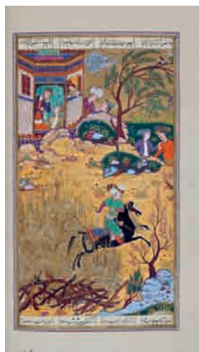
تصویر ۱۷- گذشتن سیاوش از آتش، ۱۳۵ × ۲۵۲ مم. شاهنامه شاملو، کتابخانه کاخ موزه نیاوران، تهران.

مجلس هجدهم: نبرد سپاه فریبرز با سپاه پیران، ۱۴۰ × ۲۵۰ مم. مجلس نوزدهم: بخشیدن کیخسرو طوس و سپاه او را به اندرز رستم، ۱۵۰ × ۲۵۰ مم. مجلس بیستم: شبیخون کردن ایرانیان سپاه توران را در کوه همان، ۱۸۸ × ۲۵۲ مم. (تصویر ۱۹) مجلس بیست و یکم: سخن گفتن رستم با سپاه ایران در باب پیران، ۱۷۵ × ۳۱۵ مم. مجلس بیست و دوم: به کمند گرفتن رستم خاقان چین را، ۱۳۵ × ۲۵۲ مم. مجلس بیست و سوم: کشتی گرفتن رستم با پولادوند، ۱۳۲ × ۲۵۲ مم. مجلس بیست و چهارم: انداختن اکوان دیو رستم را به دریا، ۱۳۴ × ۲۵۳ مم. مجلس بیست و پنجم: از دار رهایی یافتن بیژن با درخواست پیران از افراسیاب، ۱۳۳ × ۲۵۱ مم. مجلس بیست و ششم: برآوردن رستم بیژن را از چاه،