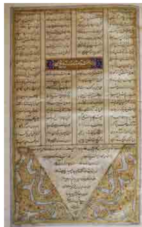
تصویر ۲- صفحهٔ انجامه شاهنامه شاملو که در آن نام کاتب و تاریخ اتمام آن در سال ۱۰۰۸ قمری برای حسین خان شاملو در دارالسلطنه هرات ذکر شده است، کتابخانه کاخ موزه نیاوران، تهران.