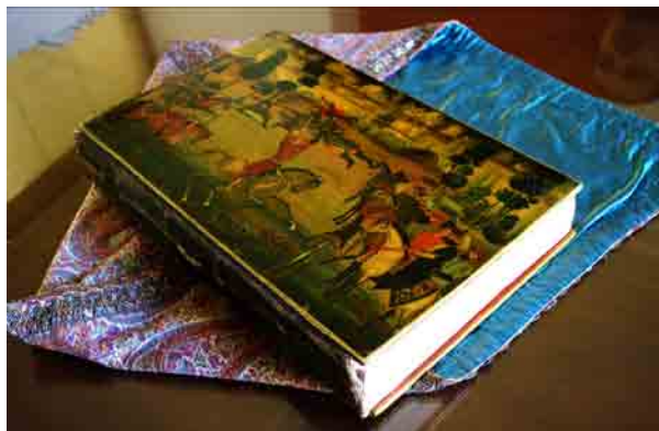
تصویر ۱- جلد شاهنامه شاملو با لفاف ترمه گلابتون قاجاری، کتابخانه کاخ موزه نیاوران، تهران.

دربار او در هرات کار کتابت و اتمام نگاره‌های این نسخه به پایان رسیده است، اگرچه شاید اتمام بعضی از نقاشی‌ها کمی متاخرتر از تاریخ کتابت نسخه باشد و چون حسین خان از سال ۱۰۰۷ تا ۱۰۲۷ ق. بر هرات حکمرانی می‌کرده است، این احتمال دور از ذهن نیست. در کتیبه‌های دو نگاره از ۴۴ مجلس مصور آن نام این حاکم نوشته شده است: یکی در نگاره "گذشتن سیاوش از آتش" که به روی صفحه ۱۶۶ (پشت ورق ۸۳) نقاشی شده است؛ در این نگاره بر سردر کاخ، جایی که سودابه در کنار کیکاوس به صحنه گذشتن سیاوش از آتش نگاه می‌کند، عبارت "حسین خان عادل" خوانده می‌شود. نوشته دیگر در نگاره داستان "رزم کیخسرو با افراسیاب و گرفته شدن گنگ دژ" قرار دارد. در این نگاره، کتیبه‌ای بر بالای پنجره‌ای که دو پیکره روی زمینه قرمز با گل و بوته‌های سفید در آن نقاشی شده‌اند، دیده می‌شود. روی زمینه لاجوردی مذهب کتیبه، این عبارت به رنگ سفید خوانده می‌شود: "در کتاب‌خانه نواب نامدار حسین خان عادل" (تصاویر ۳ و ۴).