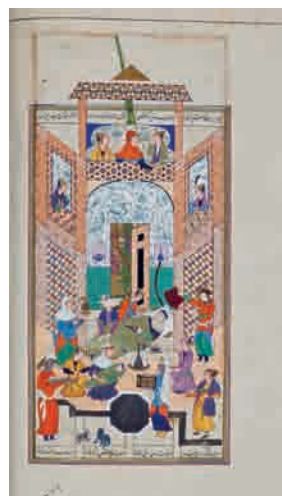
تصویر ۱۵- به دنیا آمدن رستم، اندازه ۱۳۶ × ۳۰۶ م، شاهنامه شاملو، کتابخانه کاخ موزه نیاوران، تهران. ماخذ: (انتشارات زرین و سیمین)

و ساخت این نسخه اگر چه در هرات انجام یافته اما شیوه اجرای نگاره‌های آن پیوندی آشکار با آثار نقاشان اواخر سده دهم و اوایل سده یازدهم در قزوین و اصفهان دارد. در واقع خلاقیت هنرمندانی که تا حوالی سال ۱۰۰۶ در کتابخانه سلطنتی قزوین فعال بودند، از یکسو در مکتب اصفهان به شکوفایی رسید و از سوی دیگر در هرات و در کتابخانه حسین خان و حسن خان شاملو دنبال شد و مورد حمایت قرار گرفت. در مجموع قلم بیش از یک هنرمند در نقاشی‌ها دیده می‌شود. در برخی از نگاره‌ها زنان قدبلند و کشیده اندامی نقاشی شده‌اند، به نحوی که تناسبات پیکر آنها بلندتر از معمول است و از مردان قدبلندتر دیده می‌شوند؛ همان خصوصیتی که در آثار محمدی و شاگرد او محمد مومن دیده می‌شود. در صخره‌نگاری، چهره‌پردازی، کشیدن اسب‌ها و رنگ‌آمیزی در نگاره‌ها نیز تفاوت قلم دیده می‌شود. در نگاره‌هایی نیز به شیوه معمول رقع‌نگاری‌های مکتب اصفهان، تصاویر حیوانات خانگی مثل سگ و گربه نقاشی شده است، مثلاً در مجلس تولد رستم و مجلس دیدار اسکندر با گوش بستر (مجلس چهارم، تصویر ۱۵ و مجلس سی و نهم، تصویر ۱۴). این مسئله معمولاً در شاهنامه‌های قدیمی‌تر دیده نمی‌شود. رنگ‌آمیزی زمینه تعدادی از نقاشی‌ها نیز ناتمام مانده است و البته آسیب‌هایی نیز به واسطه چسبندگی بعضی از صفحه‌ها در تعدادی از نقاشی‌ها به