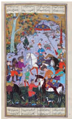
تصویر ۱۴- دیدن اسکندر گوش بستر را در راه بابل، ۱۳۵ × ۲۵۰ مم، شاهنامه شاملو، کتابخانه کاخ موزه نیاوران، تهران.

وجود آمده است. در مجموع، مهارت در رنگ آمیزی، ظرافت اجرا و ترکیب‌بندی‌های خوبی که در مجموعه نقاشی‌ها و صفحات مذهب دیده می‌شود، نشان از تهیه این نسخه نفیس به عنوان یک سفارش درباری دارد.