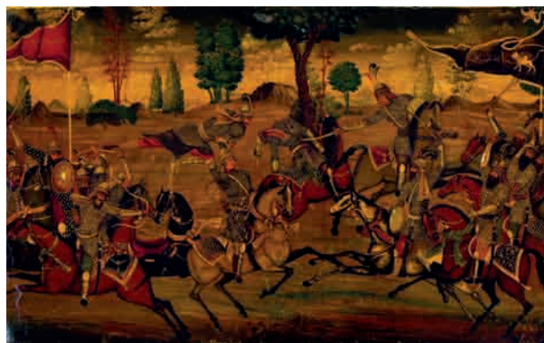
تصویر ۵- نقاشی روغنی روی جلد شاهنامه شاملو، کتابخانه کاخ موزه نیاوران، تهران.

مداد به فارسی نوشته شده است: ۱۶۲ احمدی. پس از ورق اول، یک ورق تازه برای نوشتن متن اهدای نسخه توسط دفتر مخصوص اضافه شده است. پشت این ورق (روی صفحه سه)، اهدائیه کتاب بمناسبت پنجاهمین سال تاسیس پادشاهی پهلوی در روز اول فروردین ۲۵۳۵ [۱۳۵۵]، به محمدرضا پهلوی با امضای فرح پهلوی به خط تحریری استادانه قلمی شده است (تصویر ۹). ۵