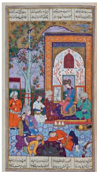
تصویر ۲۰- شبیخون زدن شاپور به قیصر روم، ۱۳۵ × ۲۵۲ مم، شاهنامه شاملو، کتابخانه کاخ موزه نیاوران، تهران.

مجلس هجدهم: نبرد سپاه فریبرز با سپاه پیران، ۱۴۰ × ۲۵۰ مم. مجلس نوزدهم: بخشیدن کیخسرو طوس و سپاه او را به اندرز رستم، ۱۵۰ × ۲۵۰ مم. مجلس بیستم: شبیخون کردن ایرانیان سپاه توران را در کوه همان، ۱۸۸ × ۲۵۲ مم. (تصویر ۱۹) مجلس بیست و یکم: سخن گفتن رستم با سپاه ایران در باب پیران، ۱۷۵ × ۳۱۵ مم. مجلس بیست و دوم: به کمند گرفتن رستم خاقان چین را، ۱۳۵ × ۲۵۲ مم. مجلس بیست و سوم: کشتی گرفتن رستم با پولادوند، ۱۳۲ × ۲۵۲ مم. مجلس بیست و چهارم: انداختن اکوان دیو رستم را به دریا، ۱۳۴ × ۲۵۳ مم. مجلس بیست و پنجم: از دار رهایی یافتن بیژن با درخواست پیران از افراسیاب، ۱۳۳ × ۲۵۱ مم. مجلس بیست و ششم: برآوردن رستم بیژن را از چاه،