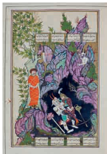
تصویر ۱۶- رزم رستم با دیو سپید، ۱۸۶ × ۳۰۵ مم، شاهنامه شاملو، کتابخانه کاخ موزه نیاوران، تهران.

مجلس هشتم: به آسمان رفتن کیکاوس به اغوای ابلیس، ۱۴۵ × ۲۵۲ مم.