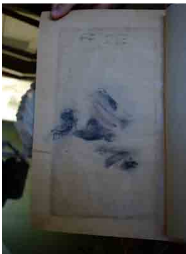
تصویر ۱۰- پاک شدگی صفحه یادداشت، شاهنامه شاملو، کتابخانه کاخ موزه نیاوران، تهران.