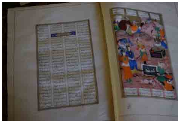
تصویر ۱۳- پند دادن منوچهر لشکریان را پس از کشته شدن سلم، ۱۴۰ × ۲۵۲ مم. و سرلوح میانی در صفحه روبروی آن، شاهنامه شاملو، کتابخانه کاخ موزه نیاوران، تهران.

و ساخت این نسخه اگر چه در هرات انجام یافته اما شیوه اجرای نگاره‌های آن پیوندی آشکار با آثار نقاشان اواخر سده دهم و اوایل سده یازدهم در قزوین و اصفهان دارد. در واقع خلاقیت هنرمندانی که تا حوالی سال ۱۰۰۶ در کتابخانه سلطنتی قزوین فعال بودند، از یکسو در مکتب اصفهان به شکوفایی رسید و از سوی دیگر در هرات و در کتابخانه حسین خان و حسن خان شاملو دنبال شد و مورد حمایت قرار گرفت. در مجموع قلم بیش از یک هنرمند در نقاشی‌ها دیده می‌شود. در برخی از نگاره‌ها زنان قدبلند و کشیده اندامی نقاشی شده‌اند، به نحوی که تناسبات پیکر آنها بلندتر از معمول است و از مردان قدبلندتر دیده می‌شوند؛ همان خصوصیتی که در آثار محمدی و شاگرد او محمد مومن دیده می‌شود. در صخره‌نگاری، چهره‌پردازی، کشیدن اسب‌ها و رنگ‌آمیزی در نگاره‌ها نیز تفاوت قلم دیده می‌شود. در نگاره‌هایی نیز به شیوه معمول رقع‌نگاری‌های مکتب اصفهان، تصاویر حیوانات خانگی مثل سگ و گربه نقاشی شده است، مثلاً در مجلس تولد رستم و مجلس دیدار اسکندر با گوش بستر (مجلس چهارم، تصویر ۱۵ و مجلس سی و نهم، تصویر ۱۴). این مسئله معمولاً در شاهنامه‌های قدیمی‌تر دیده نمی‌شود. رنگ‌آمیزی زمینه تعدادی از نقاشی‌ها نیز ناتمام مانده است و البته آسیب‌هایی نیز به واسطه چسبندگی بعضی از صفحه‌ها در تعدادی از نقاشی‌ها به