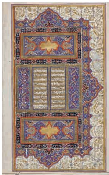
تصویر ۱۲- لت سمت راست سرلوح دو صفحه ای، شاهنامه شاملو، کتابخانه کاخ موزه نیاوران، تهران.

ادامه متن شاهنامه در صفحات بعد از سرلوح ادامه می‌یابد با این توضیح که تمامی صفحات احتمالاً در دوره قاجار همزمان با تجلید و مرمت آن متن و حاشیه شده و دارای جدول کشی به ابعاد ۲۵۰×۱۳۵ میلیمتر است. هر صفحه شامل چهارستون ۲۹ تا ۳۰ میلیمتری است که فاصله میان ستون‌ها نیز شش میلیمتر