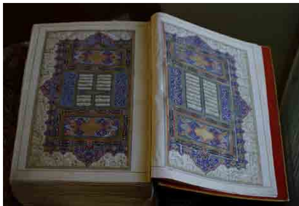
تصویر ۱۱- سرلوح دو صفحه ای، شاهنامه شاملو، کتابخانه کاخ موزه نیاوران، تهران.

دو صفحه بعد که آغاز شاهنامه است، با سرلوح بسیار زیبایی بدون امضایی تزئین شده است. این شاهنامه، فاقد مقدمه است و متن آن بدون عنوان در دو ستون که بین آنها طلاندازی و محرر شده، از همین سرلوح آغاز می‌شود. این سرلوح دو صفحه‌ای دارای تذهیب مرصع و تشعیری مرکب از اسلیمی‌ها و ختایی‌های زیبایی است که نمونه آن در کتاب آرایی این دوره کمتر دیده می‌شود، بخصوص اینکه شرفه‌ها روی حاشیه تشعیر کشیده شده‌اند. اشعار درون سرلوح در ۹ سطر نوشته شده‌اند و میان سطرها طلاندازی شده و با گل‌ها و برگ‌های ظریف و رنگارنگ تزئین شده است. این سرلوح دارای رنگ لاجوردی پررنگی است