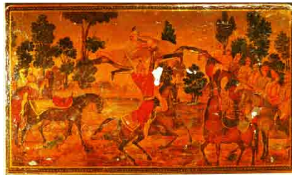
تصویر ۷- نقاشی روغنی روی جلد شاهنامه موسوم به میرزا صالح، نسخه شماره ۲۲۵۰، متعلق به کاخ موزه گلستان، تهران.