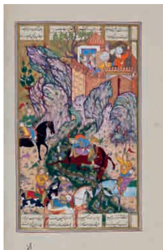
تصویر ۱۸- جنگ طوس با فرود و کشته شدن اسب طوس، ۱۴۷ × ۲۵۲ مم. شاهنامه شاملو، کتابخانه کاخ موزه نیاوران، تهران.