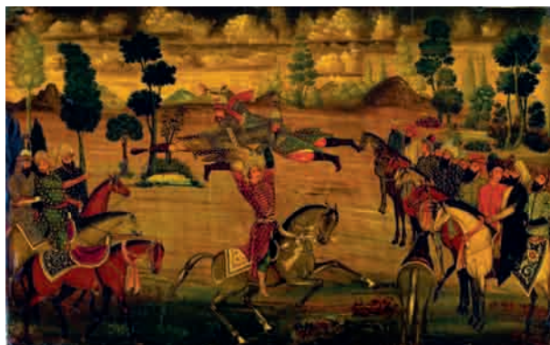
تصویر ۶- نقاشی روغنی پشت جلد شاهنامه شاملو، کتابخانه کاخ موزه نیاوران، تهران. ماخذ: (انتشارات زرین و سیمین)