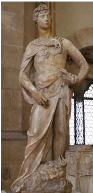
تصویر ۲- قدیس گئورگیوس.

که تصمیم‌های سیاسی این سال‌ها بیانگر آن است در واقع‌گرایی پرهیبت هنر تبیین می‌شود» (همان، ۳۳). پیکره داوود، همراه با کتیبه و دلالت‌های آشکار و ضمنی دینی و سیاسی‌اش نقش قهرمان رنسانس آغازین را بازی کند، قهرمانی بی‌پیرایه و ساده اما استوار بر پای خود از طبقه متوسط که یکبار در اواخر قرن دوازده و اوایل قرن سیزده میلادی اقتدار یافته، حکومت جمهوری تشکیل داده و پس از سپری کردن دورانی از درگیری‌های طبقاتی و شورش‌های پیرو آن، اکنون در جایگاه امیران و اشرافیان قرار گرفته، با این حال همچنان خصلت‌هایی نظیر سادگی و بی‌پیرایی را حفظ کرده است. هاوزر در ادامه تأکید می‌کند این پیکره و سایر آثار دوناتلو به عنوان هنر طبقه متوسط، همچنان ارتباط خود را با کلیسا و مراکز مذهبی حفظ کرده، اما جهت انطباق با تقاضاهای خصوصی برای هنر و ویژگی کلی‌خردگرایی آن روزگار، خصلتی دنیوی به خود می‌گیرد (همان، ۳۲). این آثار معمولاً به سفارش طبقه متوسط شهری و صاحبان مکتب و با اصناف شکل می‌گرفت. «شهروندان دارا و معتبر دولت‌شهرها مایل بودند که نام نیک پس از مرگ برای خود دست و پا کنند [...] وقف‌های کلیسایی، مناسب‌ترین روش تأمین شهرت جاوید بدون روبرو شدن با انتقاد عمومی بودند. [...] پارسایی به هیچ وجه دیگر انگیزه در وقف هنر کلیسایی نیست. حتی مدیچی‌ها ۲۲ خردمندانه تشخیص دادند که به حمایت از هنر خود رنگی مذهبی بزنند» (همان، ۴۵). ویژگی‌هایی چون جسمانی‌تر، سنگین‌تر، آرام‌تر، آزادتر و طبیعی‌تر بودن که هاوزر به‌عنوان خصائل آثار هنر رنسانس اوایل قرن پانزدهم فلورانس به آن اشاره دارد (همان) با شدت کمتری در این اثر به چشم می‌آید؛ آثار بعدی دوناتلو بیش از این مبین صفات مذکورند.