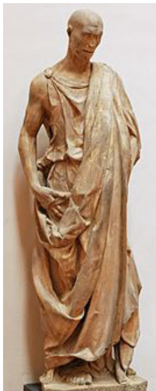
تصویر ۴- پیغمبر کله‌کدو.

اومانیست جمهوری فلورانس بسیار پرشور توصیفش می‌کردند- چکیده تمام فضائل که گاه بحران به کار می‌آید (هارت، ۱۳۸۶، ۱۷۵). چهره که شاید جایگاه اصلی نمایش فردیت انسان است در این اثر به وضوح و با قدرت بیشتر پرداخت شده است. اسپور درباره مفهوم فردیت می‌گوید: «دل مشغولی به چندگانگی و فردیت انسان هر آینه در پسینگاه قرون وسطی پدید آمد آنگاه که افق‌های گسترده و پیچیدگی افزایش یافته زندگی بحث‌های تازه درباره مسئولیت انسان براساس یک نظام اخلاقی استوار و برای اداره کردن رویدادها بودند. همچو بحث‌ها فلسفه‌ای فرا آوردند سازوار با اصول مسیحی که اعتنائش را بر کرامت و ارزش ذاتی فرد متمرکز می‌کرد. نوع بشر به نیکی و کمال‌پذیری ممیز گشت و توان آن داشت که خودشکافی و خرسندی فکری این جهانی بیابد» (۱۳۸۵، ۲۴۵)، درباره مسئله فردیت در قرن پانزدهم م. می‌توان به اندیشه‌های کوزانوس ۲۶ نیز اشاره کرد که فردیت را نه در تقابل با امر کلی (خداوند) بلکه تحقق حقیقی آن می‌دانست؛ چنین نتیجه‌ای ناشی از تلاش وی جهت برقراری ارتباط میان امر متناهی و نامتناهی است، وی در نهایت با ارائه تمثیلی به وجود رابطه خاص هر فرد با خدا تأکید می‌کند (کاسیرر، ۱۳۸۸، ۹۵-۹۶). این امر به‌طور حتم متأثر از فضای سیاسی و اقتصادی ایتالیای زمان اقامت کوزانوس در آنجا نیز بود (همان، ۹۹). از این پس فردگرایی توأم با واقع‌گرایی، با شدت بیشتر در آثار دوناتلو حضور می‌یابد.