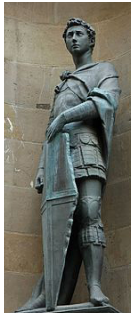
تصویر ۱- داوود مرمرین.