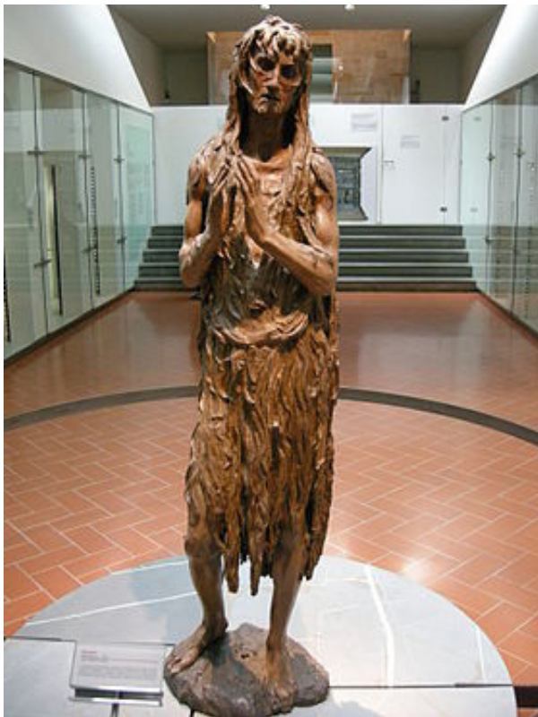
تصویر ۷- مریم مجدلیه.