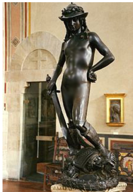
تصویر ۵- داوود مفرغی.

بصری تاثیرگذار مشهود بر سطح این پیکره برنزی استادانه تراشیده شده است، [...] دلیل جذابیت فراوان این جلوه‌های بصری را می‌توان در رنگ تیره و تقریباً سیاه برنز جستجو نمود. وازاری گفته بود: "شور و زیبایی پیکره [داوود] چنان زنده می‌نماید که هنرمندان گاه تندیس بودن اثر را از یاد می‌برند." طبیعت‌گرایی بنیادین اثر حائز اهمیت بسیار است زیرا پیکره برنزی داوود نه با تصویر آرمانی رنسانسی و نه گونه هنری کهنی مطابقت دارد و داوود برای احراز معیارهای هر یک از دو الگو همچنان بسیار جوان، خام‌دست و قدری زیاده از حد زیباست: جلوه‌هایی همچون چین‌خوردگی‌های ناحیه تحتانی سرینی و اطراف زیر بغل‌ها، شکم تا حدودی فرو رفته و سرین اندکی فرونشسته باورپذیری اثر را دوچندان می‌کند و به‌رغم آنکه اثر آشکارا پیکره‌ای مردانه است، اما چنان به‌نظر می‌رسد که دوناتلو کوشیده است تا صفات زنانه را در قالب زیبایی و لطافت بدن، ظرافت نسبت‌ها و برآمدگی جزئی ناحیه معده در معرض نمایش گذارد. به‌نظر می‌رسد که سرشت نرینه نوجوانی ضمن نادیده انگاشتن خام‌دستی و بی‌ثباتی‌اش مورد تاکید است. پیکره برنزی داوود شاید احیاگر گونه کهن برهنه‌نگاری آزاد در ابعاد زنده در نظر آید اما به‌سختی می‌توان نکته‌ای کهن در باب اثر یافت. «بنت در ادامه می‌افزاید که: «با این همه، تفسیر دوناتلو فاقد تضاد با متن کتاب مقدس است که خود بر جوانی و زیبایی بهترین فرزند یسی [داوود] صحه گذارده است: [...] برهنگی داوود همچنین از ارتباطی ضمنی با متن کتاب مقدس برخوردار است چرا که داستان اول سموئیل در باب ۷: ۹-۳۸ شرح می‌دهد که چگونه داوود ابتدا زره طالوت را به تن کرده و سپس از تن بدر می‌آورد و تصمیم می‌گیرد تا در میدان نبرد زره بر تن نکند و حتی متن کتاب