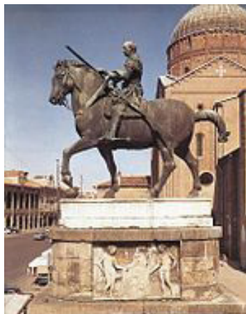
تصویر ۶- گاتاملاتا.

دوناتلو در ۱۴۴۳م. به ونیز در شمال ایتالیا سفر کرد تا سفارش ساخت پیکره فرمانده لشکریان ونیز را به انجام برساند. این پیکره یادآور پیکره سوار بر اسب مارکوس اورلیوس ۲۸ است که احتمالاً دوناتلو در دیدار از رم آن را دیده بود. این پیکره که بر بالای پایه‌ای بلند و بیضی شکل قرار گرفته تا از محیطش مجزا شود، تجلی سرآغاز استقلال پیکرتراشی از معماری است. امیر ارتش در زرهی که تلفیقی است از سبک رنسانس و رومی، نمایش داده شده و در کل اثر، شکل‌ها، جهت افزایش حجم ظاهری، ساده شده‌اند. این اثر که محل اتحاد میان آرمان و واقعیت است (جنسن، ۱۳۵۹، ۳۲۱)، با ترکیب هر می‌شکل خود به آثار کلاسیک اوج رنسانس نزدیک می‌شود. «البته این گرایش‌های یونانی نبود، بلکه نگرش‌های همانندی را باز می‌تابانید» (پاکباز، ۱۳۷۸، ۲۶۳). چهره این پیکره بیش از شباهت به اصل، چهره‌ای آرمانی از فرماندهی است که دوناتلو احتمالاً هرگز وی را ندیده چرا که پیش از ورود وی به پادوا از جهان رفته بود (هارت،