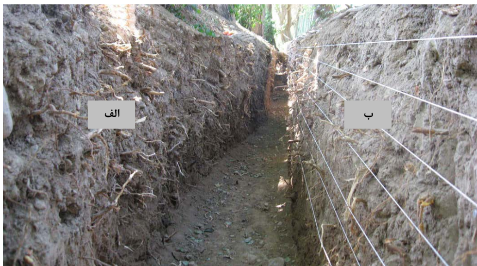
شکل ۱. وضعیت پروفیل؛ الف: دیواره نزدیک به درختان؛ ب: دیواره دور از درختان

برای کسب داده‌های RAR از روش دیواره پروفیل استفاده شد [۸، ۹]. با توجه به ردیفی‌بودن درختان، نقطه‌ای تصادفی در امتداد آن‌ها انتخاب و یک پروفیل پیوسته به طول ۱۰ متر (موازی با امتداد درختان) بررسی شد. در بررسی تراکم، کلیه ریشه‌های دیواره نزدیک (فاصله ۰/۵ متر) و دور (فاصله ۱/۰ متر) پروفیل نسبت به درختان در افق‌های ۱۰ سانتی‌متری برداشت شد [۶]. نمایی از پروفیل در شکل ۱ نشان داده شده است.