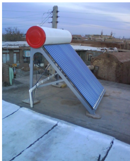
شکل ۲. نمونه‌ای از آبگرمکن خورشیدی