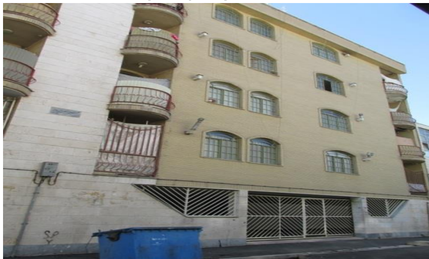
عکس ۱: نمای بیرونی مجتمع مسکونی پروانه

در این تحقیق دو مجتمع مسکونی به صورت تطبیقی مورد مطالعه قرار گرفته است. مجتمع پروانه در سال ۱۳۷۵ در منطقه ۱۵، خیابان ۱۷ شهریور جنوبی احداث شده است. این مجتمع دارای از دو مجتمع به هم متصل و در مجموع ۳۳ واحد تشکیل شده است. هر مجتمع ۸ طبقه ۲ واحدی است و ۱ واحد هم برای سرایه‌دار است. واحدهای این مجتمع جنوبی (۷۰ متر) و شمالی (۵۰ متر) است. ۲۴ واحد این مجتمع مالک و ۸ واحد مستاجر هستند.