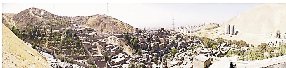
شکل ۴. وضعیت سکونتگاه غیر رسمی فرحزاد