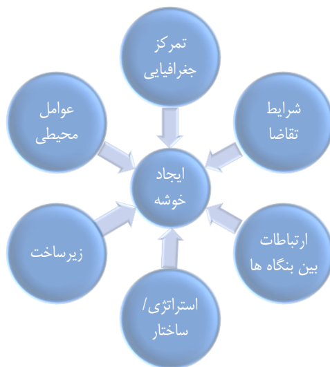
نموار ۱. مدل تحلیلی پژوهش: عوامل ایجاد خوشه صنعتی خرمای سراوان

بر اساس اطلاعات منطقه‌ای حاصل از مطالعه میدانی (حضور محقق به مدت سه ماه در منطقه) و همچنین به کارگیری روش دلفی با استفاده از پرسشنامه باز و مصاحبه حضوری با دست‌اندرکاران نهادهای مختلف مرتبط با موضوع پژوهش و مطالعه منابع موجود، مهم‌ترین اهداف ایجاد خوشه صنعتی متناسب با منطقه شناسایی شد. از آنجا که برخی از این عوامل با یکدیگر همپوشانی دارند، آن‌ها با یکدیگر ترکیب و در قالب شش فاکتور به عنوان عوامل کلی اثرگذار بر شکل‌گیری خوشه صنعتی در یک چارچوب معرفی شده‌اند.