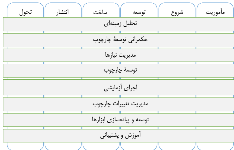
شکل ۱. شمای روش پیشنهادی

است. در پایان هر مرحله، پروژه در وضعیت خاص و جدیدی قرار می‌گیرد و چند شرط گذار ۱ خاص که برای آن مرحله در نظر گرفته شده است، محقق می‌شود.