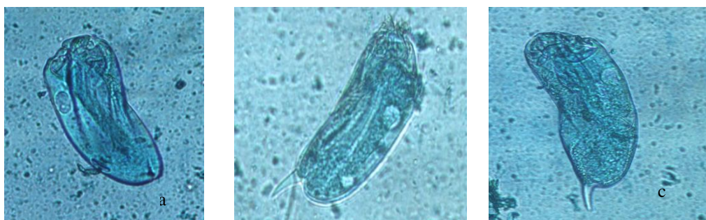
اپیدینیوم اکوداتوم (a: فرم کوداتوم b: فرم اکوداتوم c: فرم اکوداتوم)

احتمالاً وجود کربوهیدرات‌های محلول و در کل مواد مغذی در دسترس بیشتر با افزایش پنیرک، باعث افزایش تعداد پروتوزوئرها در زمان‌های اولیه انکوباسیون (۱۲ ساعت) در این آزمایش شده است. در مطالعه‌ای اثر تغییر جیره بر جمعیت پروتوزوئرها شکمبه شتر تک‌کوهانه در زمان‌های صفر، هشت، و ۱۶ ساعت خوراک‌دهی بررسی و جمعیت پروتوزوئرها در زمان ۱۶ ساعت انکوباسیون بیشتر از سایر زمان‌ها گزارش شد (۲۱). براساس نتایج تحقیق حاضر، سطوح بالاتر از ۴۰ میلی‌گرم پنیرک، با گذشت زمان و کاهش مواد مغذی و همچنین وجود مواد ضد تغذیه‌ای در آتریپلکس و پنیرک باعث کاهش جمعیت پروتوزوئرها شده است. ساپونین موجود در گیاهان گرمسیری پروتوزوئرها را از بین می‌برد و باعث کاهش تولید متان و آمونیاک می‌شود (۳۰). در تحقیق حاضر، کاهش اثر ساپونین در اثر افزودن پنیرک و نیز بالابودن