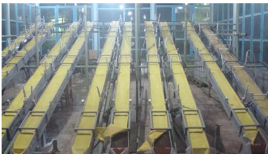
شکل ۱. تصویر و طرح شماتیکی از سیستم شبیه‌ساز دامنه