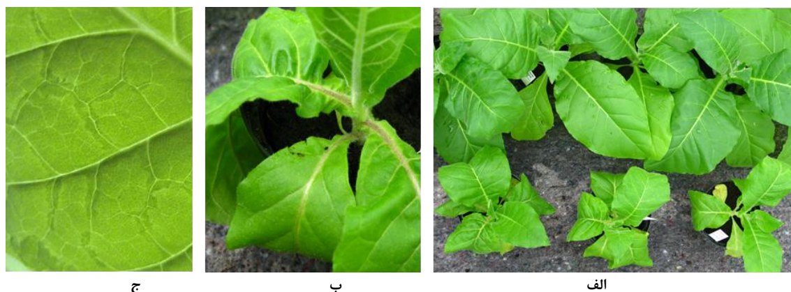
شکل ۳. برخی علائم آلودگی به PVY (الف) کاهش رشد و نکروز شدید دیمار (رگبرگ اصلی) در سه بوته تیپ وحشی توتون رقم W38 (ردیف پایین) در مقایسه با بوته‌های تراژن شده با سازه سنجاق سری (ردیف بالا) که بدون علائم‌اند. (ب) نمای نزدیک یک بوته تیپ وحشی توتون رقم W38 دارای ز شدید دیمار. (ج) علائم رگبرگ نواری.

می‌شوند (Gray et al. , 2013)، ممکن است به زودی گیاهان توتون تراژن مقاوم به PVY نیز به صورت تجاری کشت شده و به عنوان راهکاری برای حل مشکلات کشاورزان در نظر گرفته شوند. البته این امر مستلزم طی مراحل متعدد و از جمله بررسی جنبه‌های مختلف ایمنی‌زیستی است. درباره گیاه توتون خصوصاً تیپ‌های گرمخانه‌ای و بارلی این مزیت وجود دارد که کشاورزان اقدام به گل‌زنی می‌نمایند و علاوه بر این، به احتمال زیاد با روش‌های اصلاحی موجود می‌توان مقاومت تراژن به PVY (یا دیگر بیماری‌ها) را در ارقام توتون نر عقیم تلفیق کرد و به این ترتیب یکی از نگرانی‌های مرتبط با گیاهان تراژن را که انتشار دانه‌های گرده است تا حدی مرتفع کرد. همچنین روش‌هایی برای حذف ژن‌های نشانگر انتخابی (مانند مقاومت به آنتی‌بیوتیک) وجود دارند که به کارگیری آنها می‌تواند به رفع نگرانی‌ها در این زمینه کمک کند.