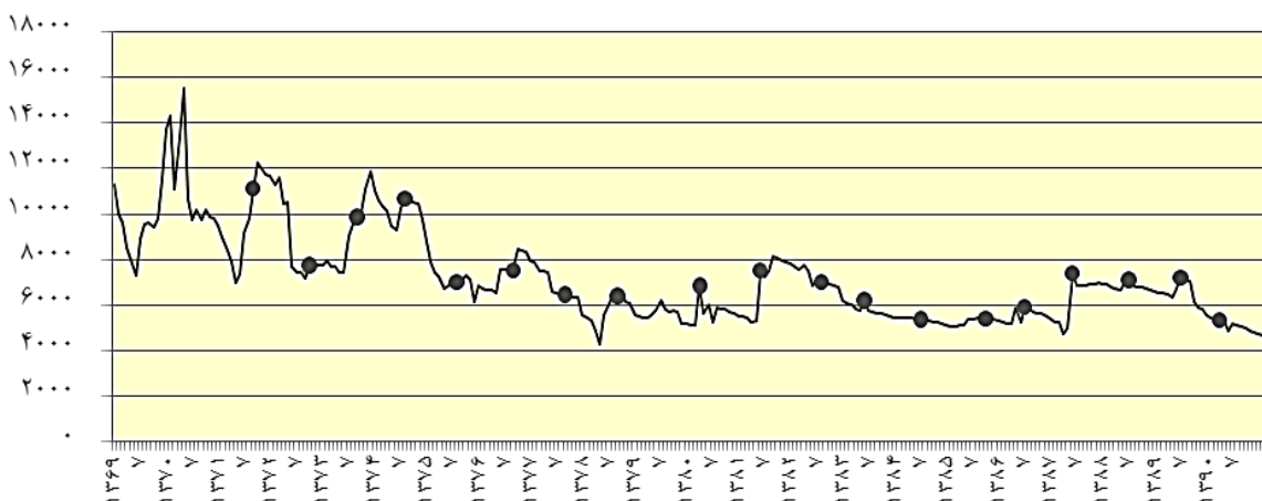
نمودار ۱. قیمت ماهانه خرما در سطح تولیدکننده با قیمت‌های ثابت سال ۱۳۸۳

داده‌های روزانه جو و گندم (canola) و برای دوره ۱۹۸۹-۱۹۸۸، نسبت تأمین را بر اساس مدل Garch تعیین کرد. Baillie & Myers (1991) با استفاده از داده‌های روزانه برای دوره ۱۹۸۶-۱۹۸۲ برای کالاهای گوشت گاو، قهوه، ذرت، پنبه، طلا و سویا، با استفاده از مدل Bgarch، نسبت تأمین حداقل واریانس را تعیین کردند. نتایج این مطالعه نشان داد نسبت‌های تأمین استخراج‌شده از مدل Garch به‌طور معنی‌داری بهتر از نسبت‌های تأمین ثابت است. مدل‌های Arch، Garch، Bgarch به‌طور وسیعی برای تعیین نسبت‌های تأمین متغیر طی زمان استفاده شدند. در زمینه کالاهای آتی می‌توان به مطالعه Baillie & Myers (1991) و Myers (1991) و در زمینه نرخ ارزهای خارجی به مطالعه Kroner & Sultan (1993) و در زمینه نرخ‌های بهره آتی به مطالعه Gagnon & Lypny (1995) و در زمینه ذخایر آتی به مطالعه‌های Park & Switzer (1995) و Tong (1996) اشاره کرد. نسبت تأمین شرطی برای مثال در مطالعه Miffre (2004)، Lien et al. (2002)، Brooks et al. (2002)، Garcia et al. (1997)، Bera, et al. (1995)، Park & Switzer (1995)، Sephton (1993)، Kroner & Sultan (1993)، al. (1995)، Cecchetti (1988)، Malliaris & Urrutia (1991)، Engle, et al. (1982)، Bollerslev (1986)، (1979) و Ederington استفاده شد. درحالی‌که Lien et al. (2002) و