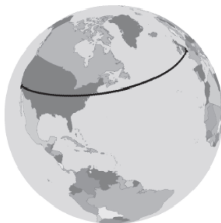
شکل ۱. تعریف مسافت با عنوان خطی مدور روی کره

اگر بخواهیم مکان تسهیلات را در منطقه‌ای بزرگ و چند ایالت یا کشور مختلف جایابی کنیم، استفاده از تخمین روی صفحه دُو بُعدی، جواب دقیقی به ما نمی‌دهد (چرچ و موری، ۲۰۰۹: ۱۴۵-۱۴۳). بنابراین همان‌طور که شکل ۱ نشان می‌دهد، باید فاصله‌ها را روی کره تعریف کنیم.