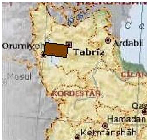
شکل ۷. چندگانگی حل بهینه در راستای هر دو محور طول و عرض

نکته مهم دیگر این است که اصولاً این نرم‌افزار امکان ارائه مشاوره‌های دقیق برای تصمیم‌گیری را ندارد و پیشنهادهای این نرم‌افزار باید در گام‌های بعدی با مطالعات تفصیلی امکان‌سنجی، قرین شود.