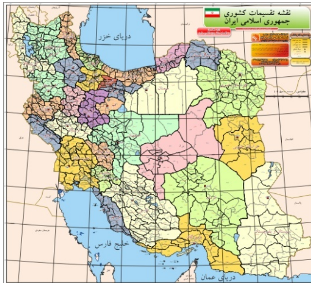
شکل ۲. طول و عرض جغرافیایی نقشه ایران

مرجع برای اندازه‌گیری طول و عرض کره ( \lambda , \varphi )، درجه‌بندی نسبت به استوا و نصف‌النهار مبدأ است که با آن هر مکانی را بر کره تعریف می‌کنند (چرچ و موری، ۲۰۰۹).