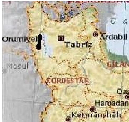
شکل ۶. ب. چندگانگی حل بهینه در راستای دو محور عرض

همین موضوع عیناً می‌تواند برای عرض جغرافیایی در دو استان مفروض اتفاق بیفتد که بر روی نقشه (ب) مشاهده می‌شود.