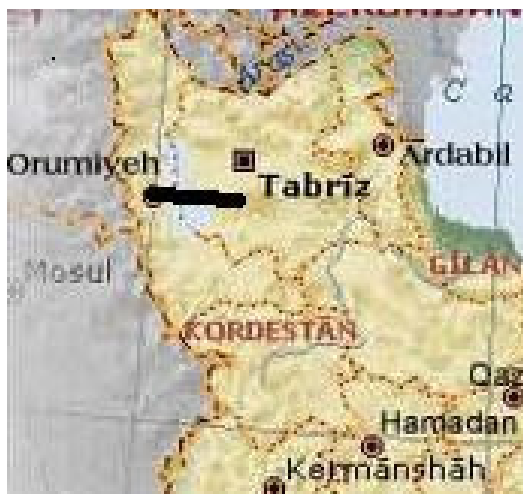
شکل ۶. الف. چندگانگی حل بهینه در راستای دو محور طول

دقیق برابر با شیب تابع هدف باشد. ۱ برای مثال، اگر در مسئله خاصی شیب کرانی خاص از فضای موجه - یعنی مرزی از فضای موجه که متناظر است با کمانی که نقطه‌ای (برای مثال ارومیه) را به نزدیک‌ترین مرکز استانی مجاور و بعدی‌اش از لحاظ اندازه طول جغرافیای (یعنی تبریز) وصل می‌کند - با شیب تصویر تابع هدف بر صفحه‌ای که حاوی متغیرهای مختص به آن کران است، برابر باشد و در همین زمان الگوریتم سیمپلکس و به تبع آن نرم‌افزار ال. پی. سالو، طول جغرافیایی بهینه را به‌طور دقیق برابر با طول جغرافیایی ارومیه تعیین کرده باشد، در این صورت نه تنها طول جغرافیایی ۴۵/۰۸۳۳ درجه، بهینه است، بلکه طول جغرافیایی ۴۶/۲۸۳ درجه (تبریز) و هر ترکیب محدب خطی ۲ بین این دو، حائز موقعیت بهینه می‌شوند، بنابراین طول جغرافیایی بهینه روی کمانی قرار می‌گیرد که ارومیه را به نقطه‌های ۳۸/۰۸۳۳ و ۴۶/۲۸۳ متصل می‌کند. ۳ بازه بهینه در این حالت روی نقشه (الف) نشان داده شده است.