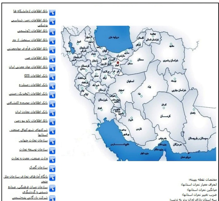
شکل ۵. نمایی از خروجی سامانه

جمع‌آوری کند. بسیاری از عوامل موفقیت کسب‌وکار به موقعیت جغرافیایی بستگی دارد؛ به این معنا که شدت و ضعف عوامل یادشده از محل استقرار آن کسب‌وکار تأثیر می‌پذیرد. بر همین مبنای این پژوهش موفق به طراحی سامانه‌ای شد که به‌طور همزمان و برخط به تعداد زیادی از کارآفرینان کمک می‌کند اطلاعاتشان را به سرعت در قالب مدلی ریاضی سازمان دهند و خروجی سامانه را برای انتخاب مکان مناسب کسب‌وکارشان در پهنه ایران، به‌کار برند. همچنین این پژوهش تلاش کرد عملکرد سیستم تصمیم‌یار طراحی‌شده را در قالب موردکاوی به تصویر کشد. همان‌طور که در صفحه خروجی نرم‌افزار (شکل ۵) مشاهده می‌شود، مختصات نقطه بهینه در این مطالعه موردی (۸۵، ۵۰، ۳۴/۱) به‌دست آمد که این نقطه در استان قم واقع شده است.