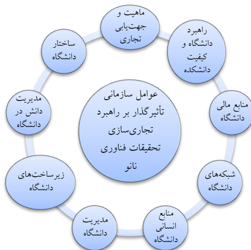
شکل ۲. چارچوب مفهومی عوامل سازمانی تأثیرگذار بر انتخاب راهبرد تجاری سازی تحقیقات فناوری نانو (محقق ساخته، ۱۳۹۳)

بعضی از عوامل سازمانی شناسایی شده در این تحقیق در پژوهش محققان دیگر مشاهده نمی شود. برای مثال منابع انسانی دانشگاه (مانند وجود نیروی انسانی خبره در حوزه فناوری نانو اعم از اعضای هیئت علمی و دانشجویان تحصیلات تکمیلی)، راهبرد دانشگاه (مانند راهبرد تجاری سازی و توسعه محصول) و شبکه های دانشگاه (مانند نفوذ و ارتباط دانشگاه در مراکز صنعتی و تصمیم گیری) که در این تحقیق به عنوان ابعادی از عوامل سازمانی مؤثر بر انتخاب راهبرد تجاری سازی تحقیقات دانشگاهی فناوری نانو شناسایی شده است، در یافته های محققان دیگر بیان نشده است. از آنجا که فناوری نانو یک فناوری نوظهور است، لذا تعداد کمی از متخصصان دانشگاهی در این حوزه تخصص دارند. بنابراین، وجود نیروی انسانی خبره مانند اعضای هیئت علمی و دانشجویان تحصیلات تکمیلی متخصص در فناوری نانو، عاملی مهم در انتخاب راهبرد تجاری سازی تحقیقات دانشگاهی در این حوزه محسوب می شود. همچنین، رویکرد سنتی آموزش صرف و تولید دانش بی توجه به ابعاد تجاری سازی آن، موجب ایجاد دغدغه و نگرانی محققانی است که به تجاری سازی یافته های تحقیقاتشان تمایل دارند. لذا وجود راهبرد تجاری سازی تحقیقات دانشگاهی در دانشگاه مخصوصاً درباره فناوری های پیشرفته و نوظهور، بر