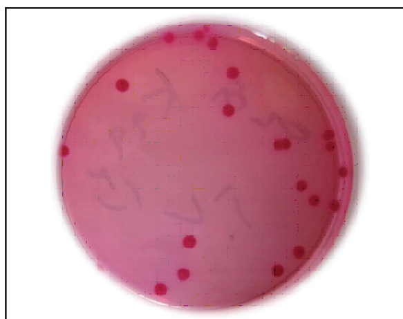
تصویر ۳. شمارش کلنی‌های باکتری اشریشیا کلی F۵ (K۹۹) از نمونه مدفوع موش گروه SB۴، ۲۴ ساعت پس از تلقیح، از رقت 10^{-7} cfu/mL روی محیط مک کانکی آگار.

باکتری E. coli و یک باکتری Proteus mirabilis بود. در نمونه کنترل فقط باکتری‌های پروبیوتیک را به گاوها تلقیح کردند، بعد از گذشت چند روز مشاهده شد که این باکتری‌ها در گاو بیماری ایجاد نکردند. در نمونه آزمایشی پس از گذشت دو روز از تلقیح باکتری‌های پروبیوتیک، باکتری HV:O۱۵۷ E. coli را به گاوها تلقیح کردند، بعد از پایان دوره بررسی باکتری‌های HV:O۱۵۷ در مدفوع گاو مشاهده نشد. نتایج این تحقیق مشخص کرد که خوراندن باکتری‌های پروبیوتیک قبل از خوراندن باکتری HV:O۱۵۷ به گاو می‌تواند به طور چشمگیری میزان باکتری HV:O۱۵۷ را کاهش دهد. طبق این بررسی یکی از متابولیت‌های تولیدی توسط باکتری‌های پروبیوتیک در دستگاه گوارشی گاو کلی سین‌ها بودند که خاصیت ضد باکتریایی بر روی HV:O۱۵۷ E. coli داشتند (۱۷).