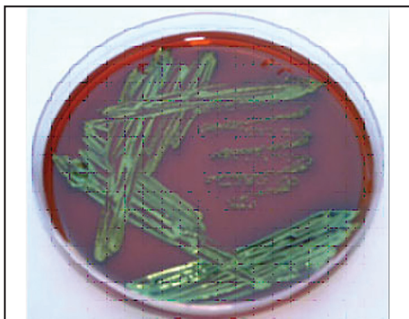
تصویر ۲. باکتری اشریشیا کلی F۵ (K۹۹) از نمونه مدفوع موش گروه چهارم، ۲۴ ساعت پس از تلقیح.