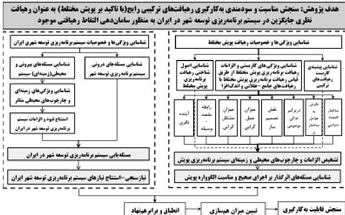
تصویر ۱- روند کار در نظر گرفته شده توسط نگارندگان برای دستیابی به هدف پژوهش.