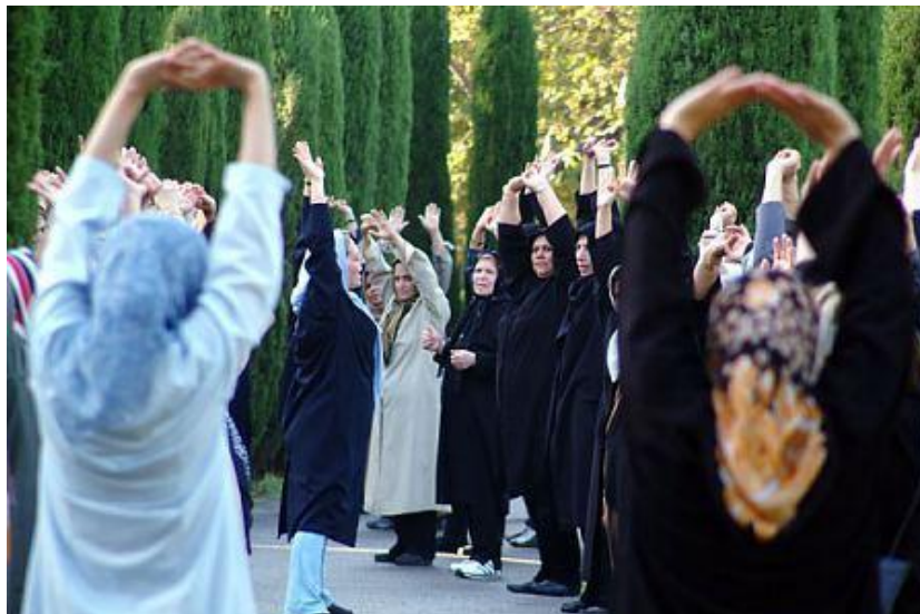
تصویر ۲: ورزش بانوان در پارک بانوان

شادابی می‌کند. ورزش موجب افزایش اعتماد به نفس و در نتیجه موجب افزایش کارایی فرد در مسئولیت‌های زندگی و اجتماعی ظاهر شود.