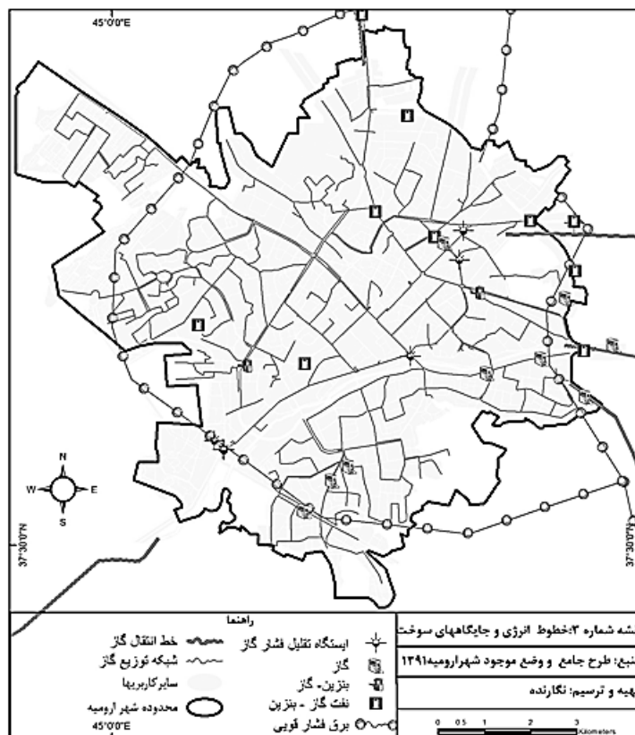
نقشه ۲. خطوط انرژی و جایگاه سوخت

پمپ‌های بنزین پتانسیل آسیب‌رسانی بالایی دارند و هنگام بحران احتمال خطر آن‌ها افزایش می‌یابد؛ بنابراین، همواره باید در انتخاب کاربری‌های همسایه آن‌ها دقت شود؛ زیرا در صورت ایجاد مشکل به نسبت فاصله با آن‌ها، طیف آسیب‌پذیری تغییر می‌کند (حبیبی و دیگران، ۱۳۹۲: ۸۵).