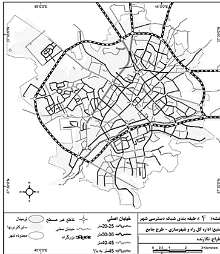
نقشه ۴. طبقه‌بندی شبکه دسترسی شهر