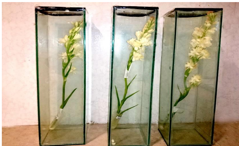
شکل ۱. ظروف شیشه‌ای طراحی شده جهت نمونه برداری و تعیین عطر گل مریم

در پی داشته است [۱۲ و ۲۷]. سالیسیلیک اسید نیز بسته به غلظت مورد استفاده سبب افزایش محتوای نسبی آب گل شاخه بریده مریم شد که می‌تواند به دلیل افزایش جذب آب از بستر بر اثر تبادلات گازی برگ با اتمسفر و همچنین نقش سالیسیلیک اسید در فرایند آنتی‌باکتریایی [۸] و در نتیجه جلوگیری از مسدودیت آوندی باشد که سبب افزایش محتوای نسبی آب گردیده است که با نتایج سایر تحقیقات بر روی گل‌های شاخه بریده میخک [۲۰] و گل رز [۳] مطابقت دارد.