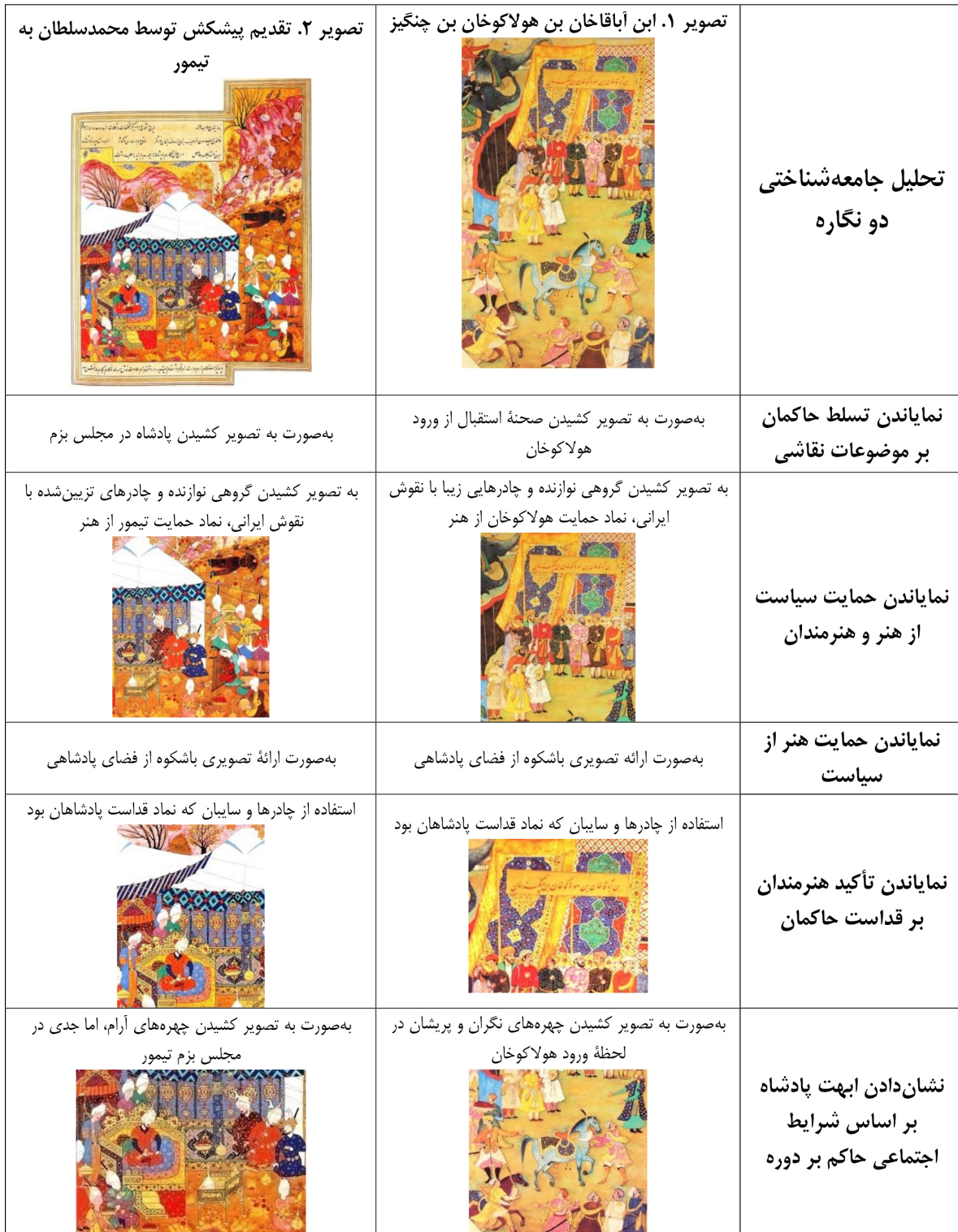
جدول ۲. تطبیق جامعه‌شناختی دو نگاره از جامع‌التواریخ رشیدی و ظفرنامه تیموری