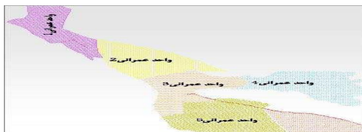
شکل ۲. موقعیت واحدهای عمرانی ۵ گانه دشت اریض