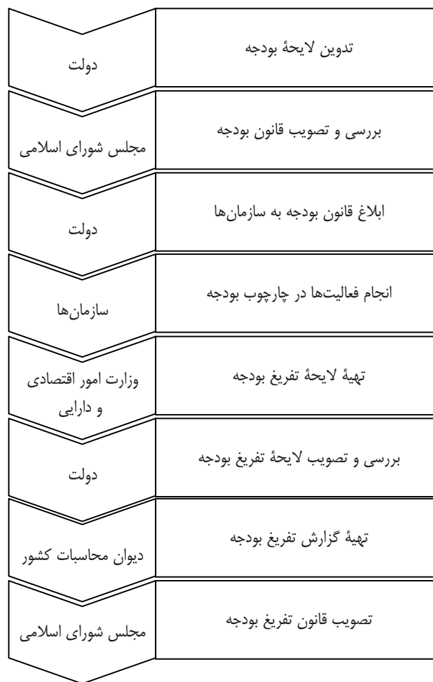
شکل ۱. مراحل تهیه لایحه بودجه تا لایحه تفریح بودجه

کشور را تهیه می‌کند. پس از تصویب این گزارش در هیئت عمومی دیوان محاسبات کشور، ریاست دیوان محاسبات آن را به مجلس شورای اسلامی تقدیم می‌کند؛ سپس گزارش تفریح بودجه از طریق «کمیسیون دیوان محاسبات و بودجه و امور مالی مجلس شورای اسلامی» در جلسه‌های علنی مجلس شورای اسلامی مطرح می‌شود. پس از تصویب قانون تفریح بودجه، مخبر کمیسیون دیوان محاسبات آن را قرائت می‌کند و در روزنامه رسمی، زیر نظر دادگستری به چاپ می‌رسد. مراحل یادشده در شکل ۱ نشان داده شده است.