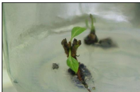
شکل ۲. استفاده از زاتین با غلظت ۱ میلی‌گرم در لیتر و کاهش تولید پینه در محل پیوند پس از یک ماه از ریزپیوندی Figure 2. Application of one mg.L -1 of zeatin that decreased callus initiation in the grafted area one month after micrografting

استفاده از تنظیم‌کننده‌های رشد گیاهی در فرآیند رشد پیوندک، یکی از روش‌های معمول برای افزایش موفقیت ریزپیوندی است (Rehman & Gill, 2015). با وجود تنوع در گیاهان مختلف استفاده شده به‌عنوان منابع پایه و پیوندک که به‌طور عمده شامل مرکبات (Edriss & Burger, 1984; Parthasarathy et al. , 1997)، گلابی (Wu et al. , 2007)، زیتون تلخ (Okpani & Ezeukwa, 1981; Nasiri et al. , 2004)، بادام (Işikalan et al. , 2011) و بادام‌هندی (Ramanayake & Kovoov, 1997) و تنظیم‌کننده‌های رشد گیاهی متفاوت در هر گیاه و مراحل مختلف ریزپیوندی، نتیجه همسانی مبنی بر افزایش معنی‌دار درصد موفقیت ریزپیوندی در همه تحقیقات به‌دست‌آمده است (Rehman & Gill, 2015).