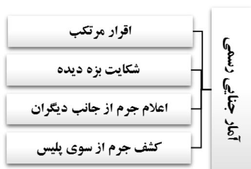
شکل ۳. مسیرهای جمع‌آوری آمار جنایی رسمی

به طور کلی چهار مسیر برای شناسایی جرائم وجود دارد که در نهایت در قالب «آمار جنایی رسمی» متبلور می‌شود. این چهار مسیر عبارت‌اند از: کشف جرم، شکایت، اقرار، و اعلام جرم. مراجع شناسایی هریک از موارد چهارگانه به ترتیب، پلیس، بزه‌دیده، مرتکب، و دیگران (سایر شهروندان جامعه) می‌باشند. به بیان دیگر، برخی از جرائم از سوی پلیس کشف شده، بعضی از طریق شکایت بزه‌دیده گزارش می‌شوند، برخی به‌واسطه اقرار مرتکب فاش شده و در نهایت، تعدادی از جرائم نیز از جانب شهروندان جامعه اعلام می‌شوند.