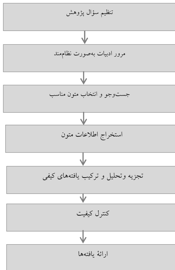
شکل ۲. مراحل پیاده‌سازی روش فراترکیب (Sandelowski, 2007)

در پژوهش حاضر برای تبیین روش‌شناسی فراترکیب از رویکرد هفت‌مرحله‌ای باروسو و ساندلوسکی استفاده شده است.